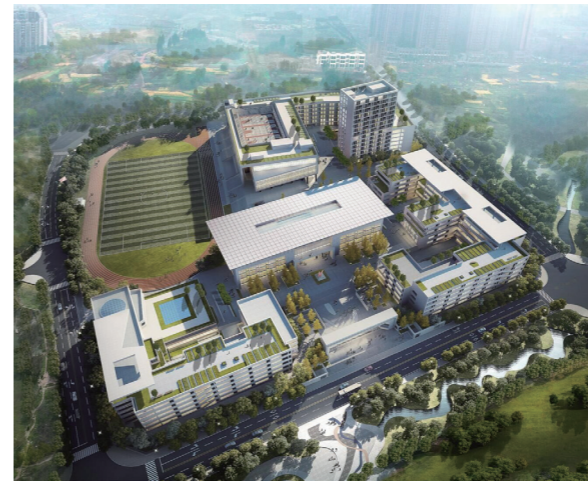
▶ 华阳中学(香山校区)项目效果图

九层之塔，起于累土。规范合理的基坑开挖方案与支护方式，才能确保基坑工程施工周期内的安全，这是所有建筑人心中的金科玉律。项目建设初期，项目部依照原设计采用放坡开挖进行基坑施工，但基坑边坡占用了大面积的施工空间，直接压缩了两个基坑中间的施工通道，使得许多大型、重型车辆进出场困难，再加上项目场地狭窄、地下条件较为复杂，且仅能通过宁安路旁的一条施工通道进出场，不仅影响土方运输、材料进场和二次流水划分，还存在车辆侧