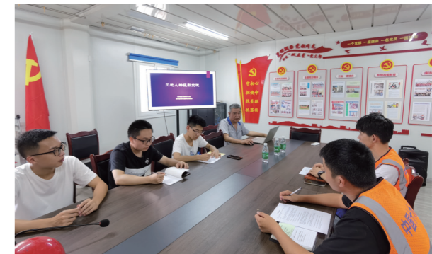
天府新区项目联合党支部开展“工地人物摄影交流”主题党日活动

除此之外，为了提升项目部的安全生产能力，该支部与科创园9号地块项目部共同策划了“行为安全之星”评选活动，通过对入场安全教育、日常安全行为、安全技术交底等表现突出的人员，现场施工作业人员安全表现突出人员，生活区安全文明行为较为突出人员，以及及时发现安全隐患、制止违章行为的员工发放“行为安全之星”积分卡的方式，将说教变为引导、把处罚变为奖励，与工友们形成了和谐的伙伴关系。