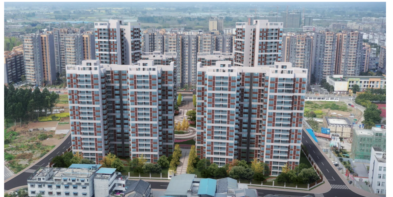
■ 邛崃羊安安置房项目效果图

“西部铁军,业主放心”,走近位于中国十九冶邛崃羊安安置房建设项目施工现场,大门外墙上赫然悬挂这句颇为形象的企业口号。这一支敢打敢拼、善作善成的建设铁军,始终坚持以高标准、高品质建设要求,用一颗服务为民的建设初心,赢得了羊安当地居民的信赖和支持。在2021年成都市工人先锋号获奖集体中,邛崃羊安安置房建设项目名列其中,这是项目团队继今年获企业内部先进集体称号后的另一殊荣,也是社会大众对其近两年辛勤付出最真诚的肯定。