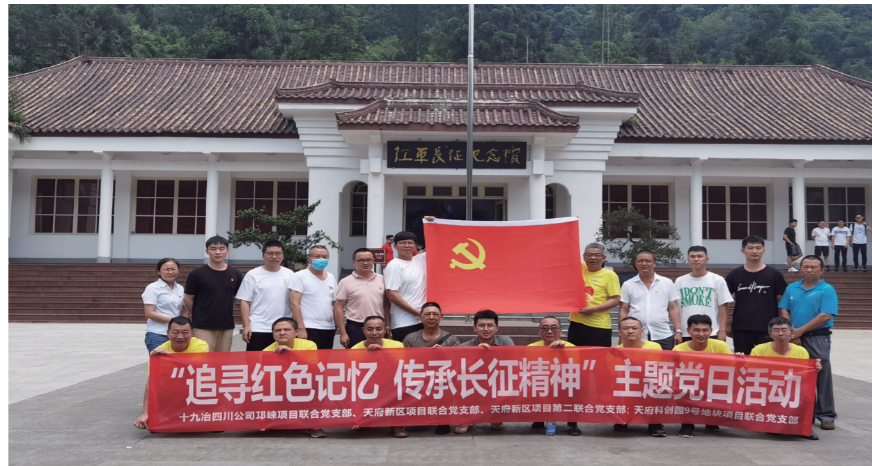
四川公司多个项目党支部联合开展主题党日活动

一名党员的作用有多大？一个党支部的作用有多大？四川公司天府新区项目联合党支部的全体党员用实际行动给出了答案。