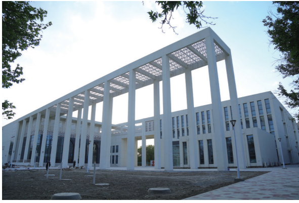
阿富汗喀布尔大学综合教学楼礼堂