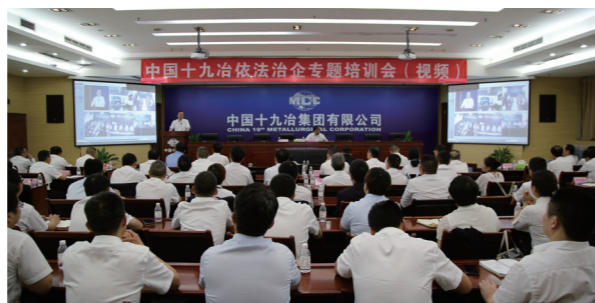
中国十九冶依法治企专题培训会

目前，中国十九冶全面推行总法律顾问制度，总法律顾问作为企业法治工作领军人物，全面参与重大决策，及时进行审核把关，有效促进企业健康发展。分子公司全部设立法律事务机构，建立和完善以法律审核管理为核心的法律管理制度体系，企业规章制度、合同、重大决策、法定代表人授权委托法律审核把关率达到100%。