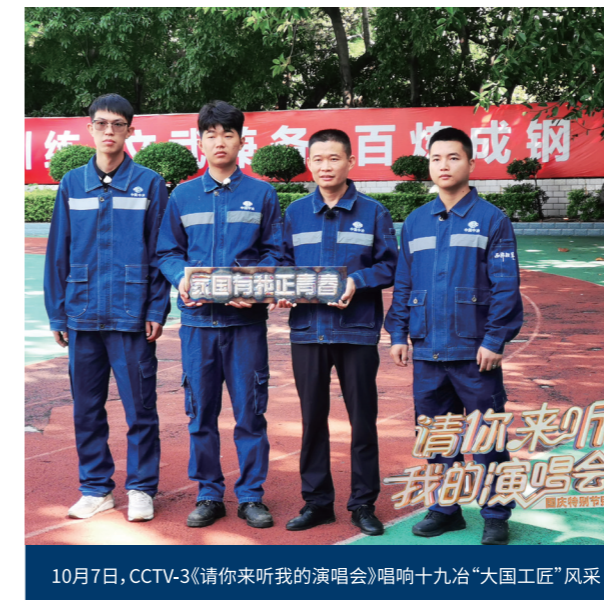
10月7日,CCTV-3《请你来听我的演唱会》唱响十九冶“大国工匠”风采