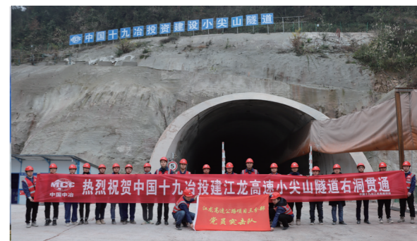
江龙高速项目小尖山隧道右幅顺利贯通

“早安排，晚部署”。每天一早，项目征拆人员按照各自分工，分头行动，到各区域开展工作。晚上汇总总结，集思广益，商