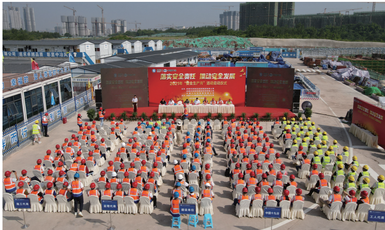
■ 华阳中学(香山校区)项目“安全生产月”活动启动仪式