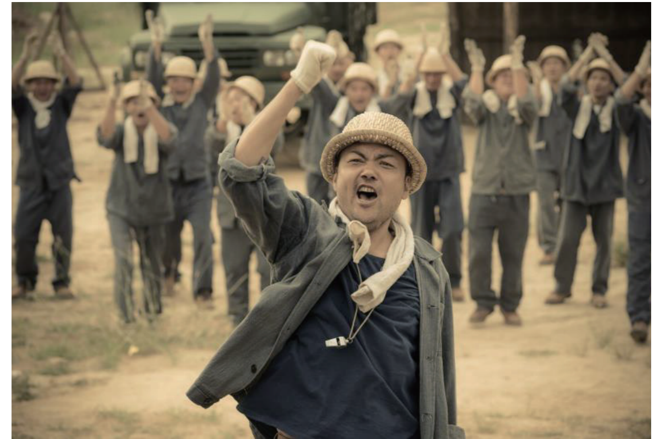
9月25日至10月16日,CCTV-1黄金档重磅推出电视剧《火红年华》