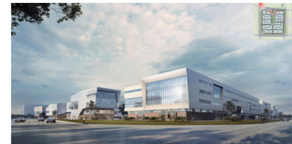
绵阳产业园项目效果图

州金彭湖项目是市场一部党员责任区的重点项目，自今年4月份获取信息以来推动了近2个月，但是收效甚微，政府想把前期工作做扎实，有意把项目包做小，从而放慢推进速度，而部门是想把项目包做大，快推，避免夜长梦多，双方的出发点不同，导致项目推进一度陷入僵局。