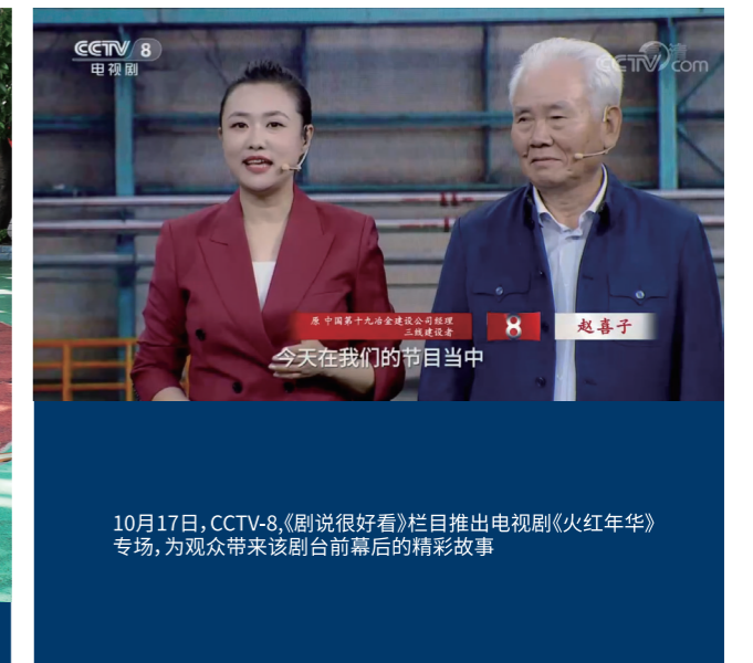
10月17日,CCTV-8《剧说很好看》栏目推出电视剧《火红年华》专场,为观众带来该剧台前幕后的精彩故事