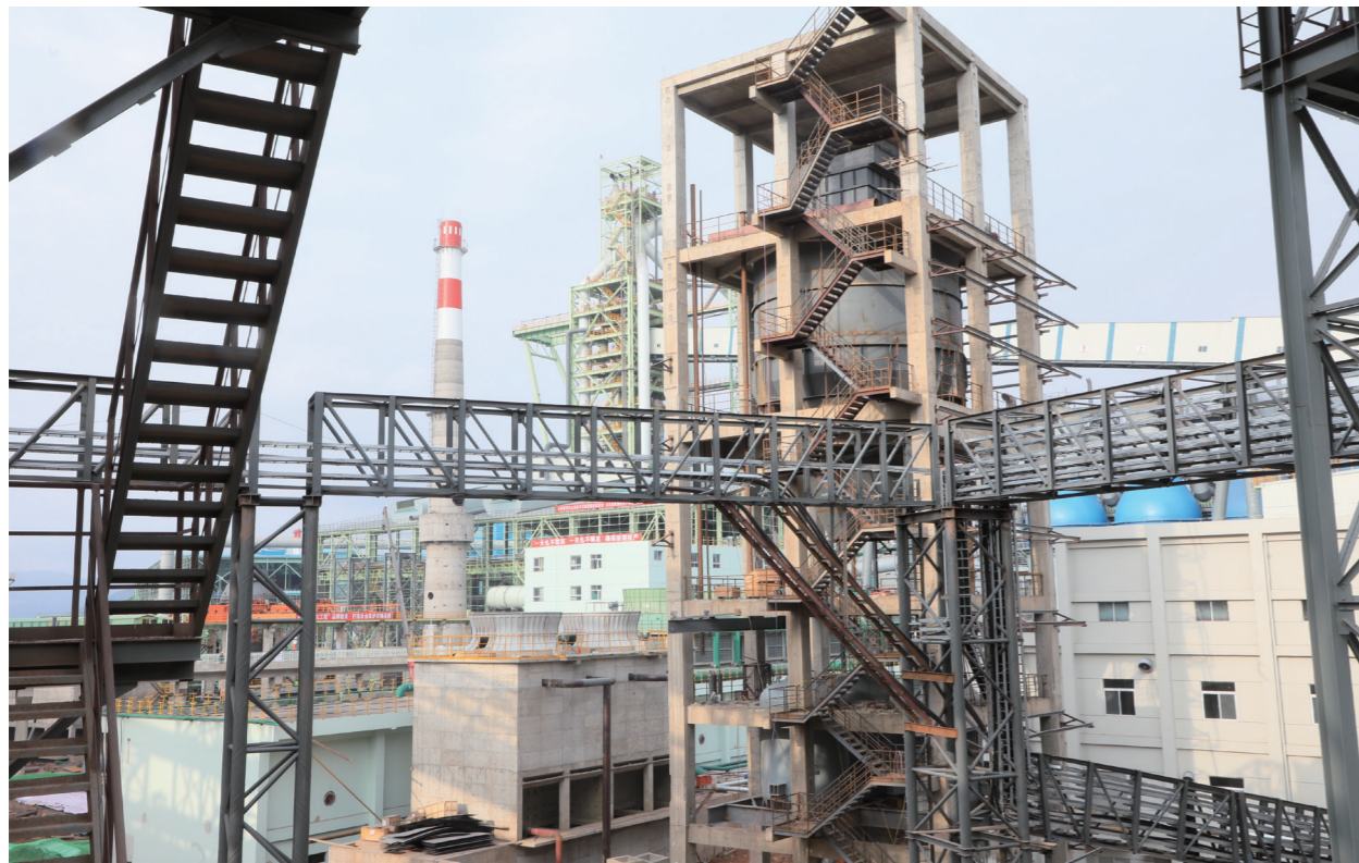
昆钢环保搬迁炼铁工程附属设施

相比冶建单位的男同志们，女同志若想在冶建项目的工作中得到认可，付出的努力相比男同志只会更多。