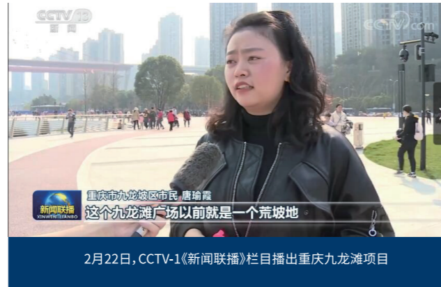
2月22日,CCTV-1《新闻联播》栏目播出重庆九龙滩项目