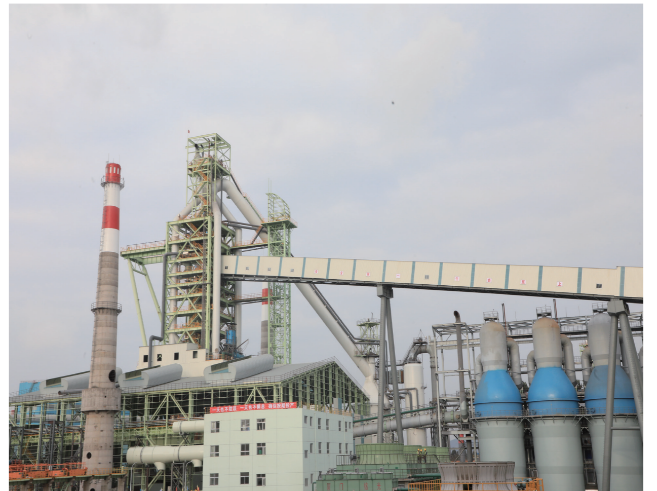
昆钢环保搬迁炼铁工程高炉本体

时间回到2021年12月,昆钢高炉项目此时距离出铁目标已不足3个月,可现场仍有大量机械设备没有安装。远在青藏高原芒康项目施工的精品班接到紧急增援通知后,立即收拾行囊,从青藏高原辗转到云贵高原,未等洗去一路风尘便出现在这片火热的工地上。对于早就习惯于打硬仗的班组来说在技术上没有难度,对他们而言,最困难的就是人手太少,分包单位技术力量薄弱,好在精品班的每个成员不仅在技术上是