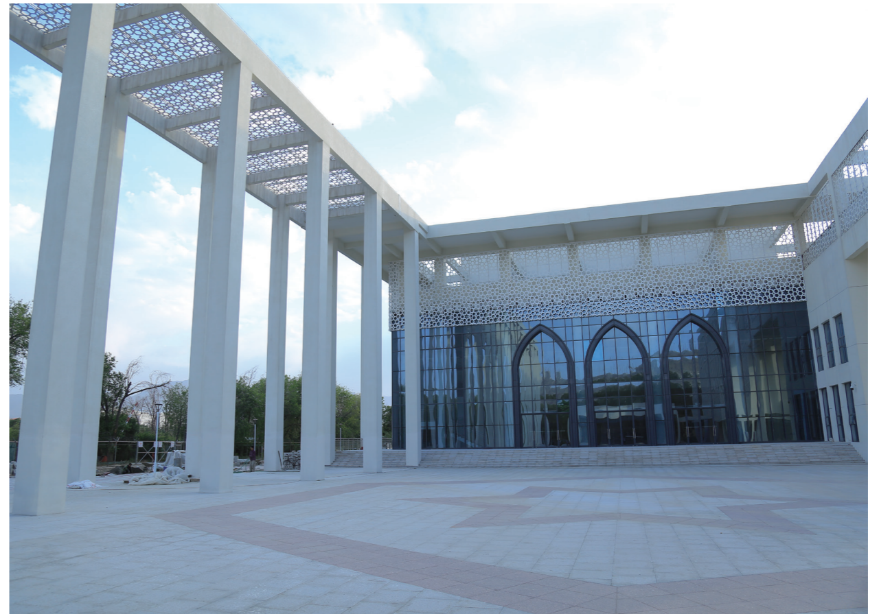
阿富汗喀布尔大学礼堂前广场

在稳步推进疫情防控工作的同时，项目现场严格按照计划表，对冬歇期到达物资进行转运工作，至同年10月主要施工人员顺利返场复工，项目现场始终维持材料状况正常，保障了物资