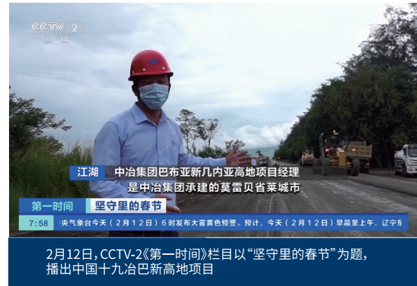
2月12日,CCTV-2《第一时间》栏目以“坚守里的春节”为题,播出中国十九冶巴新高地项目