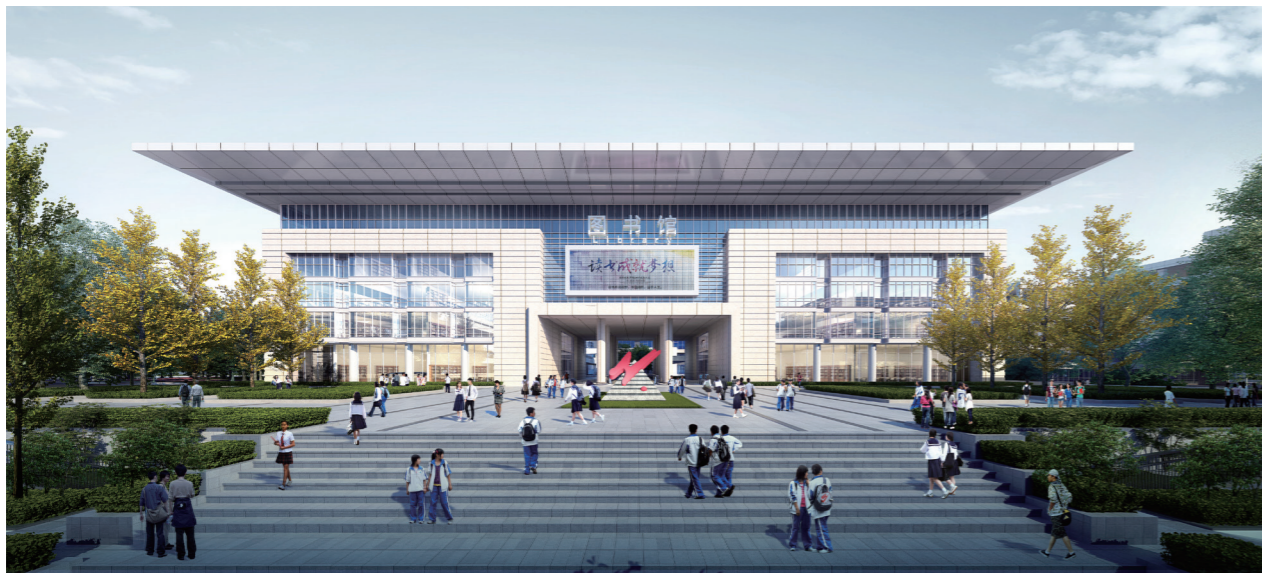
▶ 华阳中学(香山校区)项目效果图

深冬的天府新区，寒意渐浓，华阳中学(香山校区)项目施工现场却一派热火朝天的施工景象。