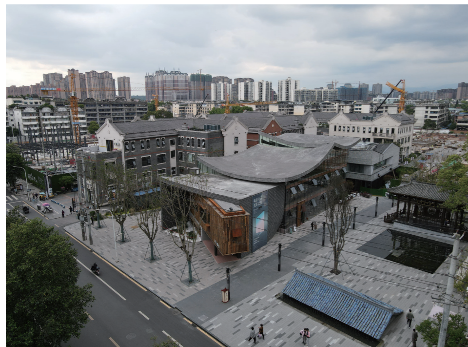
临邛古城文脉巷片区街巷复兴项目

1. 严格招标选商。一是实行全面考察机制，通过实地考察、实力评估、理念分析、风险评价等手段严格选取潜在优秀分包商；二是实行优中选优招标机制，以项目为载体，以科学合理的招标文件及评标办法为准则，由经验丰富的经济技术专家组成评标委员会，通过公平竞标确定入围分包商；三是组织开