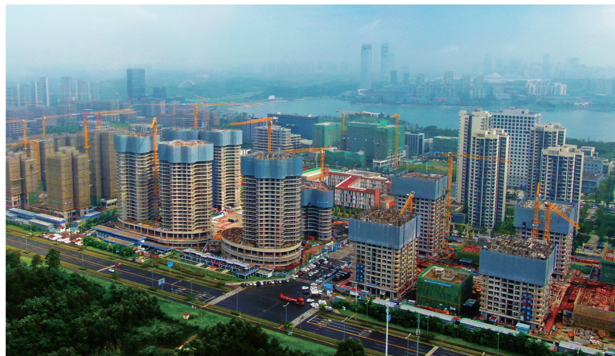
科学城天府科创园9号地块及配套项目

1. 落实责任杜绝以包代管。一是坚持“制度先行，规矩先立”，项目实施前，完善管理制度，明确管理标准及岗位职责权利，统一思想，确定目标，达到项目快速推进的