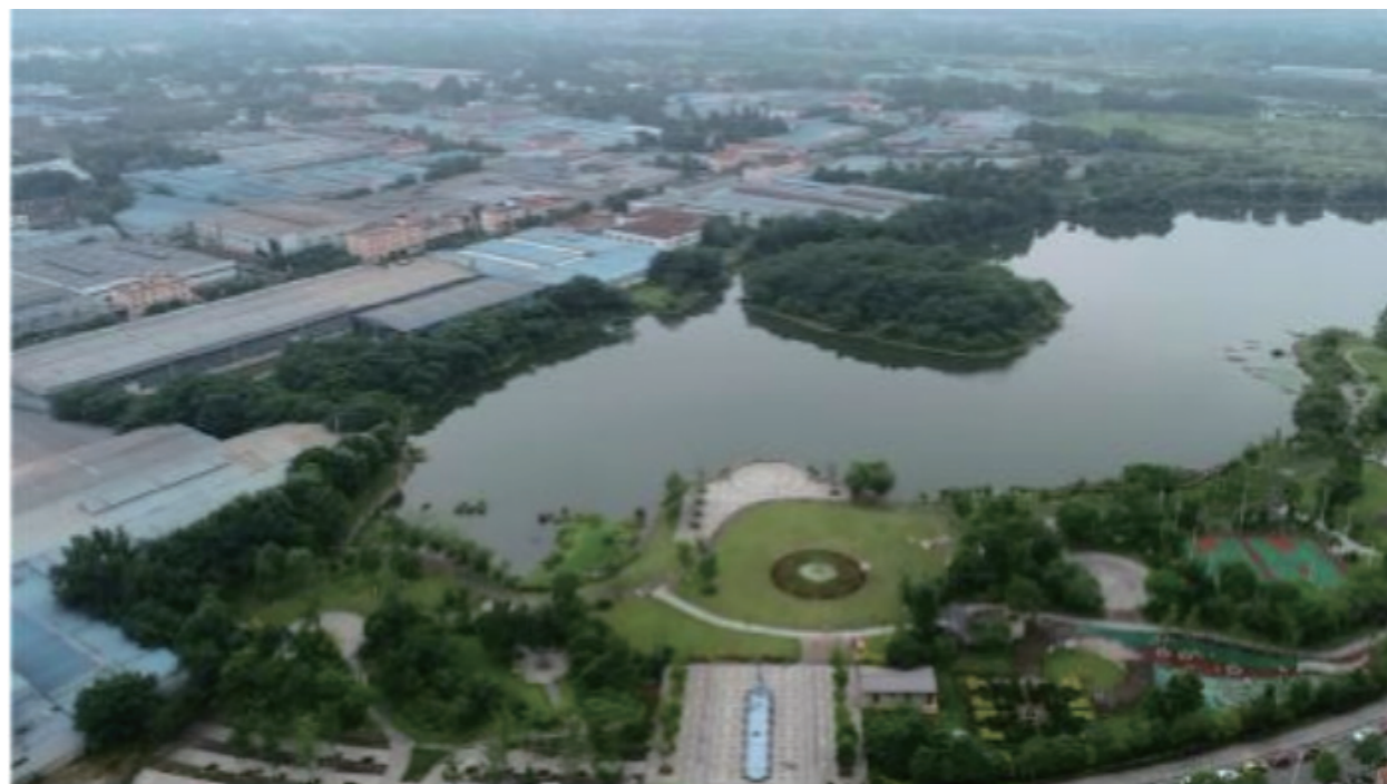
彭州金彭湖项目实景图

而另一边，部门则与战投部、经营预算部就项目报价进行了多轮测算，对五冶集团在成都周边项目的报价进行了收集、分