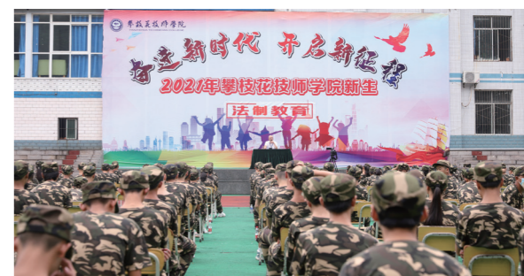
攀枝花技师学院开展新生入校法治教育

目前我公司市场规模较大的分子公司均引进了高素质的法律人才，这批人才快速成长，充满热情和斗志，对企业有责任和使命感，成为公司法务的中坚力量。在引进人才的同时，公司高度重视法律