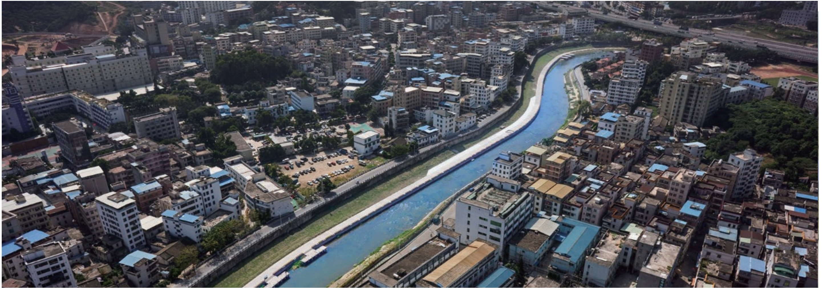
◆ 深圳公司承建的深圳观澜河治理工程

领域精雕细刻每一个项目,打造了一批敢打敢闯的“西部铁军”队伍。这支队伍对党忠诚、对企忠诚、纪律严明、技能高超,是公司在建设能源环保项目中的“穿插连”。有这样一支项目管理团队的存在,为公司项目的顺利履约保驾护航。同时公司对他们有着严格的要求:一是落实目标管理责任制,充分发挥项目部门职能作用。二是严格做好项目前期准备,编制科学高效的施工组织方案。三是加强施工现场管理,精心策划好施工现场的场区布置,合理布置各种设施,不断建设资源节约型,环境友好型,绿色健康型项目。四是强化项目管理,确保人、财、物受控,促进项目顺利履约。