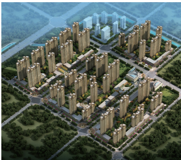
◆ 上海公司承建的安阳安置房项目(效果图)

顶上上来。面临河南突如其来的汛情,上海公司积极响应上级指示,细化落实措施,突出对重点区域项目的防汛风险防控,组织在豫所有项目启动防汛应急预案,开展安全隐患大排查,并要求各项目执行24小时轮班巡查、每日汛情两报报告制度,随时报告紧急汛情,引导党员在防汛救灾中发挥作用,全力打好一场“西部铁军”防汛的“漂亮仗”。