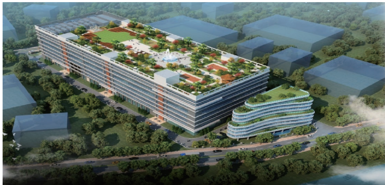
◆ 宝安江碧污水处理厂项目(效果图)

这个房间才能够更加亮堂、更加光明。作为一名老员工，我要以身作则，做好年轻员工的榜样和引路灯；作为项目负责人，我要让项目团队时刻保持乐观、积极向上的正能量；作为一名中国共产党人，我要发挥党员模范带头作用，无论是在项目工作上还是在自身能力提升上，时刻以高标准严格要求自己”。