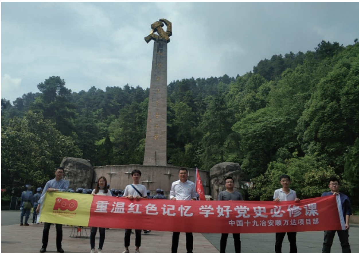
◆ 上海公司安顺万达项目部开展“重温红色记忆 学好党史必修课”主题教育活动

“江山就是人民、人民就是江山，打江山、守江山，守的是人民的心。”在习近平总书记心中，人民分量重若千钧。