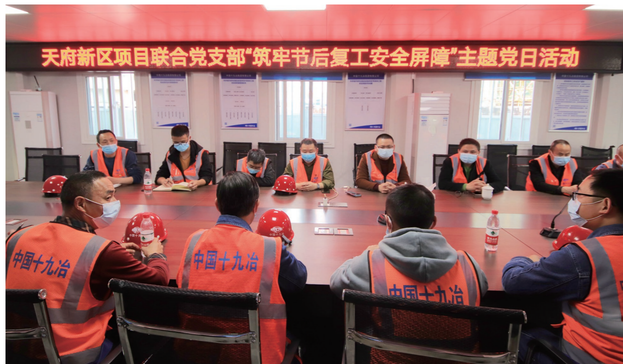
◆ 天府新区项目联合党支部开展“筑牢节后复工安全屏障”主题党日活动

习近平总书记强调，党的群团工作做得好不好，关键在党的领导，各级党委必须从党和国家工作大局出发，切实加强和改进对党的群团工作的领导。