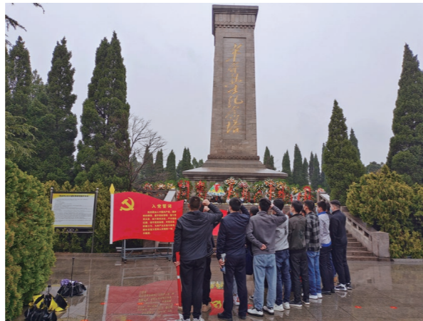
◆ 北方公司党组织开展“缅怀革命先烈”主题党日活动

作为建筑施工企业,北方公司党委始终以有利于党的基层组织作用和党员作用发挥、有利于生产经营工作开展为要求,做到项目建设团队在哪里,党组织就建到哪里,党的工作就开展到哪里。当前,公司根据工程项目建设分布,分别成立了莱钢项目联合党支部、潍坊项目部党支部、中天球团项目部党支部,发挥党支部战斗堡垒作用和党员先锋模范作用。其次是不断充实党务工作队伍,培养优秀党务工作者。通过逐步建立和完善党务工作人员和公司经营管理人员的双向交叉,把政治素质好、业务能力强、作风优良的党员骨干选派到党建工作岗位上,把党建工作岗位作为培养