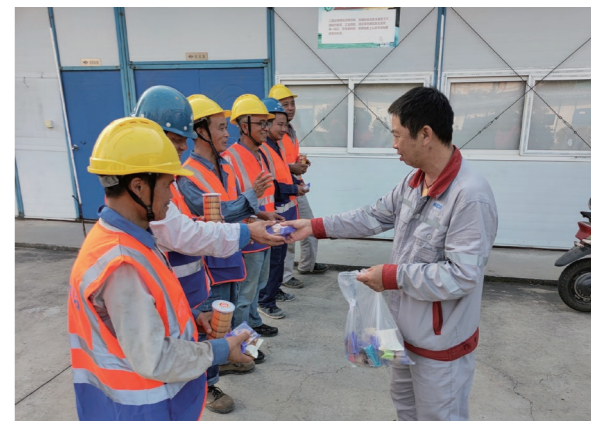
◆ 滨海项目党支部为工友送去中秋慰问

浙江公司党委始终站稳两个角度,推动实践活动走实走心。一是深入群众,站稳人民角度。浙江公司在机关一楼设立了公开征求意见信箱。6月下旬至7月中旬期间,公司领导班子成