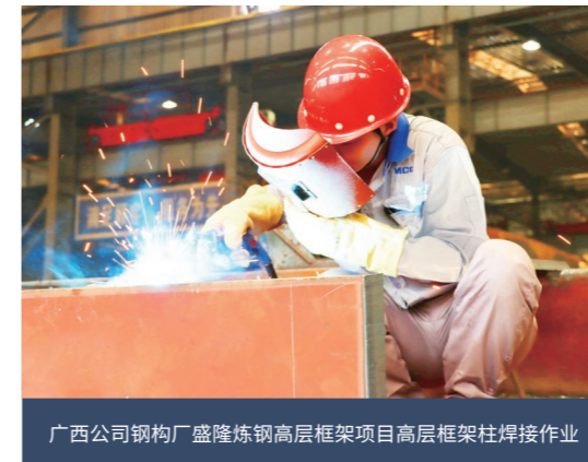
广西公司钢构厂盛隆炼钢高层框架项目高层框架柱焊接作业