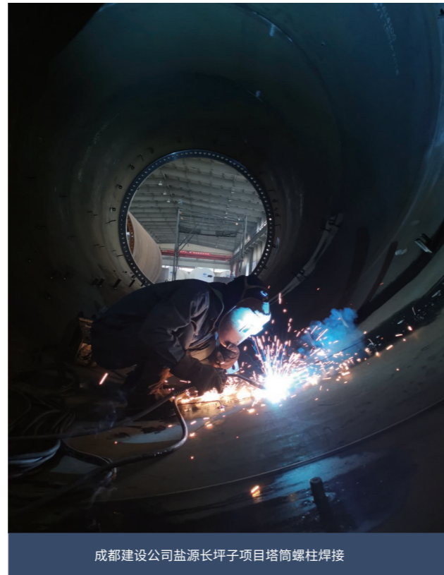
成都建设公司盐源长坪子项目塔筒螺柱焊接