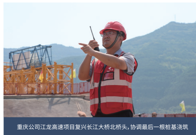
重庆公司江龙高速项目复兴长江大桥北桥头，协调最后一根桩基浇筑