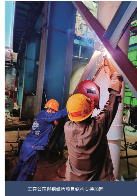
工建公司柳钢维检项目结构支持加固