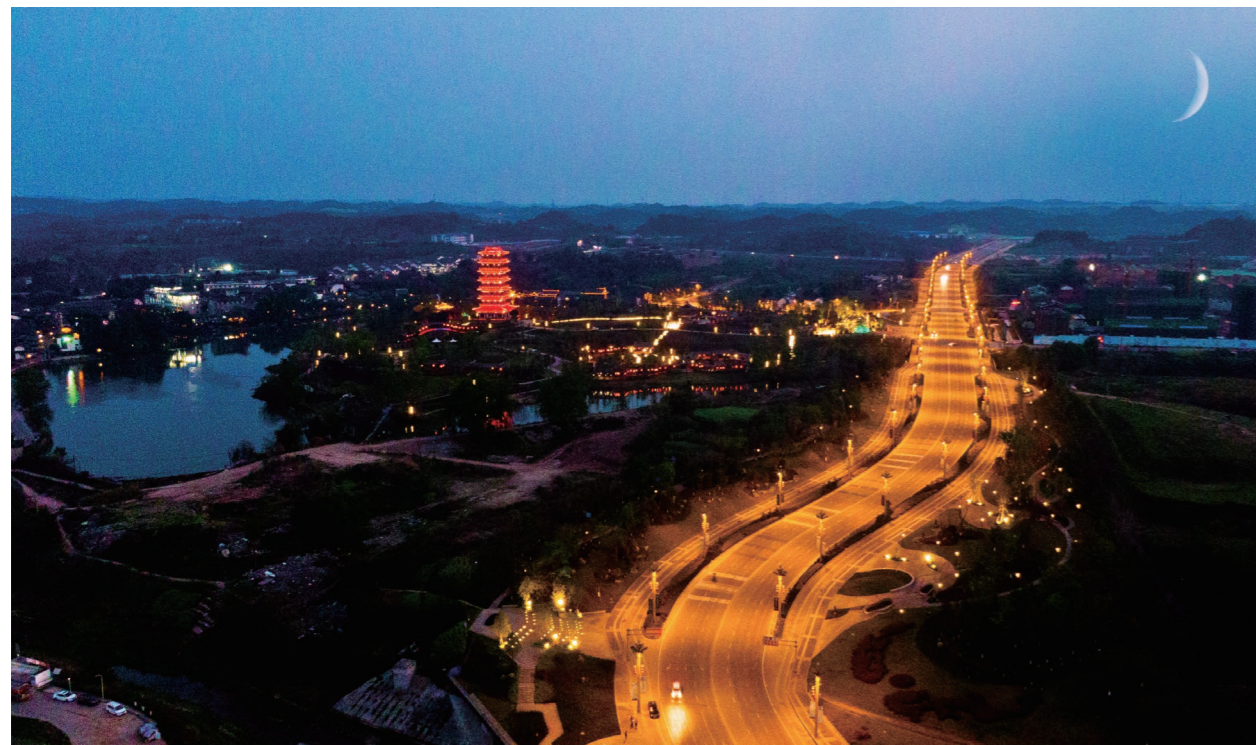
◆ 市政交通公司承建的遂宁市船山区PPP项目

自党史学习教育开展以来，市政交通公司党委严格按照中央、省市、集团公司党委关于学习教育的部署安排，健全组织、压实责任、强力督导，学习教育起步迅速、推进有序、氛围浓厚、特色突出，坚持打实、硬碰硬，确保学习教育真正落在全心全意为人民服务的核心宗旨上，切实解决广大职工、群众的“急愁盼难”，将党史学习教育转化为推动公司高质量发展的不竭动力。