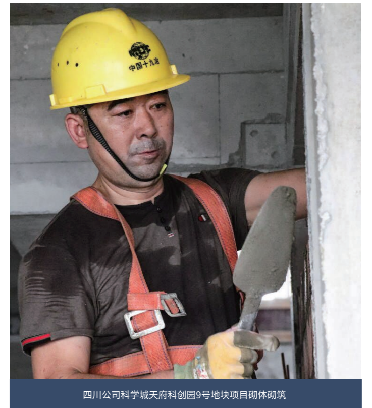
四川公司科学城天府科创园9号地块项目砌体砌筑