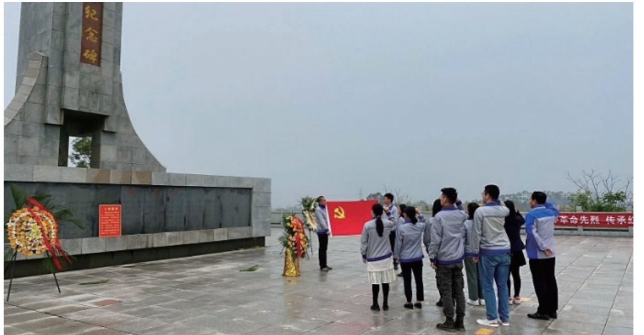
◆ 广西公司机关党支部开展“缅怀革命先烈，传承红色基因”主题党日活动

一个个以革命先辈为榜样的红色资源教学现场、一次次涤荡心灵的深入学习和研讨、一场场人气满满的党史宣讲、一桩桩为民分忧解难的民生实事……党史学习教育在广西公司内火热开展、滋养着广大党员的初心使命。