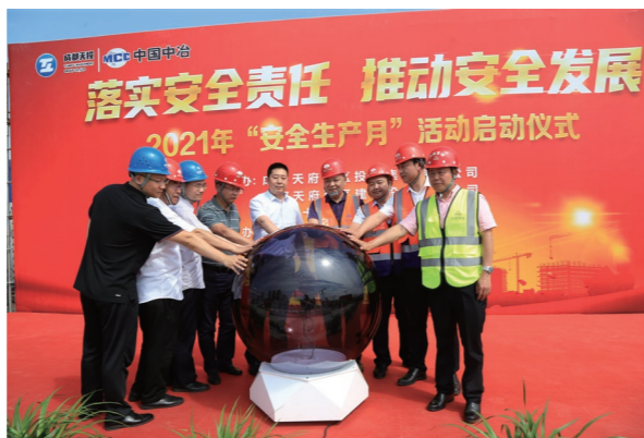
◆ 中国十九冶2021年“安全生产月”活动启动仪式

调研、积极策划，在全公司范围内推广实施“行为安全之星”活动。通过评选“行为安全之星”“安全观察之星”，为公司的生产经营营造“全员、全方位、全过程”安全管理氛围。