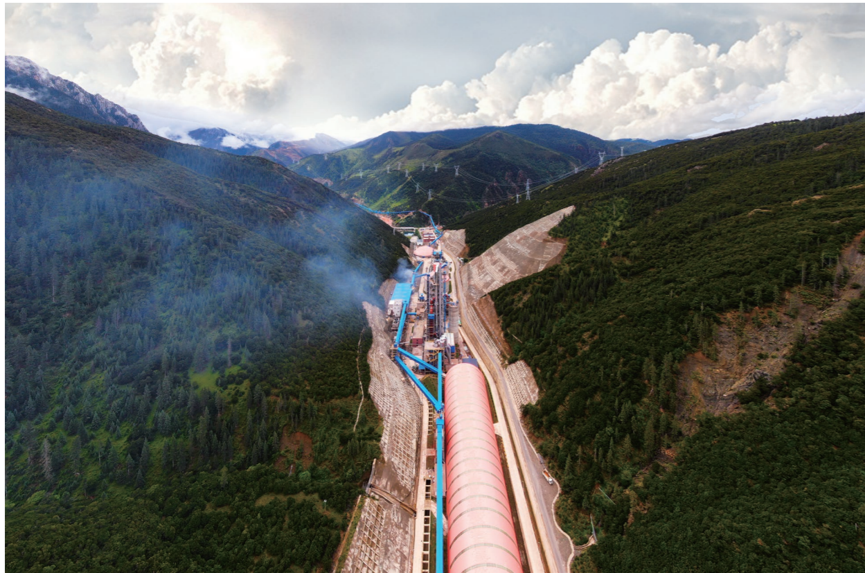
◆ 西藏开投海通水泥有限公司2000吨/天新型干法水泥生产线工程