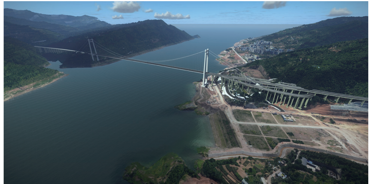
◆ 中国十九冶承建的江龙高速项目复兴长江大桥(效果图)

“西部铁军”精神是中国共产党精神谱系的有效传承，是伟大建党精神在工业报国体系的延伸，是支撑中国十九冶战胜一切艰难险阻、始终立于不败之地的精神支撑。50多年来，“西部铁军”精神以其独有的时代特征和特殊内涵，激励着一代又一代十九冶人在社会主义现代化征程中奋勇拼搏、屡创奇迹。