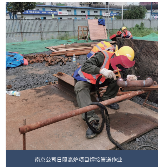
南京公司日照高炉项目焊接管道作业