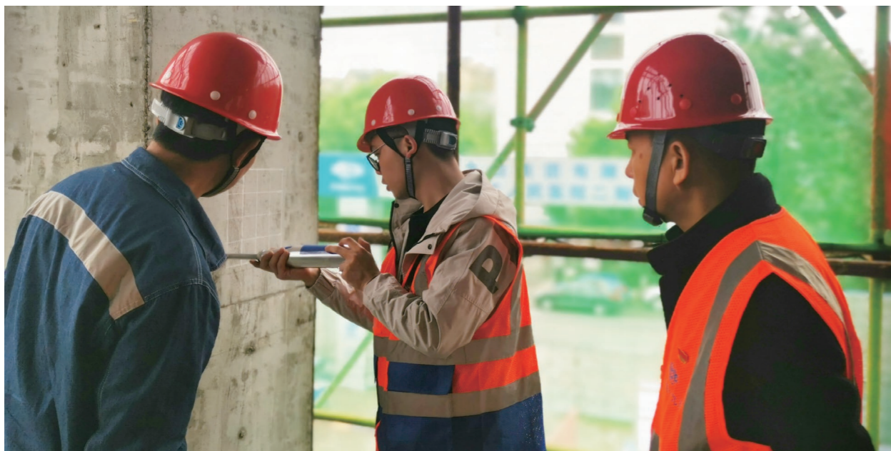
◆ 都江堰项目党支部开展“党建引领践初心 守护质量筑精品”主题党日活动

任区、工人先锋队，广泛发动党员、群众化身“安全生产啄木鸟”“隐患排查显微镜”，各项目部党支部以高处作业、临边孔洞、施工用电、起重吊装为重点，深入排查安全事故隐患，建立隐患清单，制定整改措施。机关第一、第二党支部的党员按照“四不两直”原则采用例行检查、专项检查和突击检查等方式，全年开展安全隐患排查114次，共查处各类安全隐患722项，发出安全隐患整改通知单114份，齐心协力推动各类安全隐患整改闭环到位，让安全氛围在每一位党员、群众身边“扩散”。坚持“党建+考核激励”到位，在公司党委正确领导和行政的大力支持下，公司工会建立了以考核检查评比、表彰奖励为主要手段的“安康杯”竞赛激励机制。公司党委也十分注重竞赛结果的运用，今年6月，1名安全员党员被公司评为“优秀共产党员”。