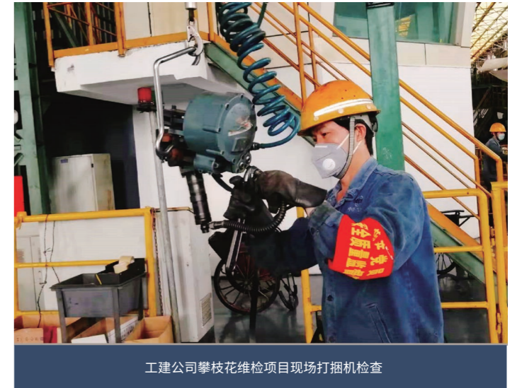
工建公司攀枝花维检项目现场打捆机检查