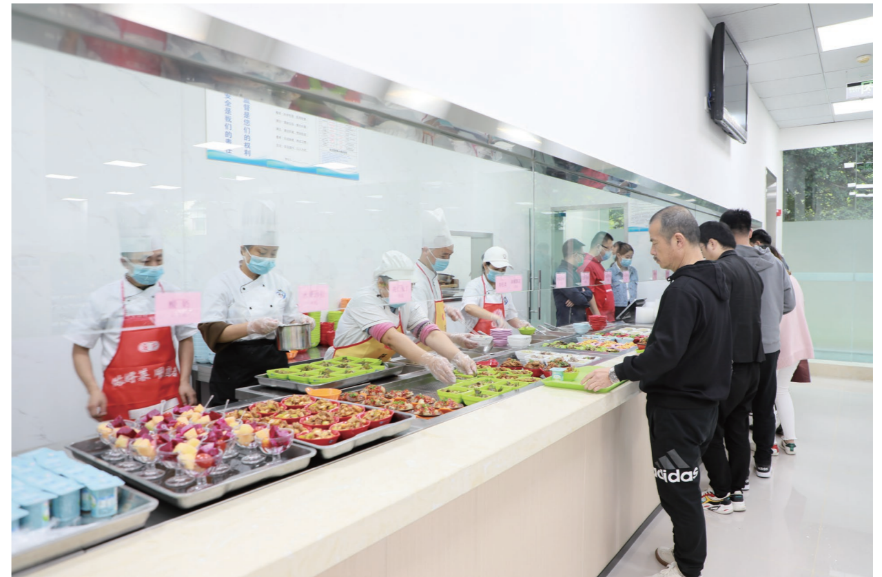
◆ 改造后的成都大厦食堂取餐窗口

在高楼林立的深圳大湾区，在鳞次栉比的重庆九龙滩，在车水马龙的成都东二环，在错落有致的“象牙微雕”攀枝花……55载风雨，十九冶集团通过坚忍不拔的奋斗，在党的带领下，职工群众的拥护下，走出大山、开拓市场、报效国家。