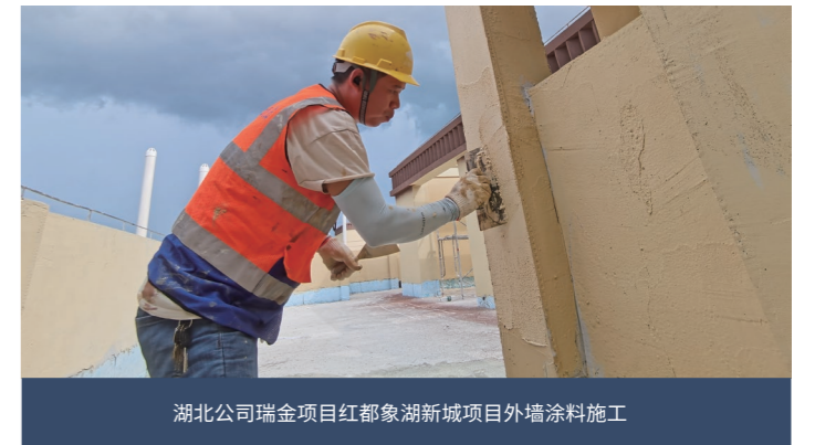
湖北公司瑞金项目红都象湖新城项目外墙涂料施工