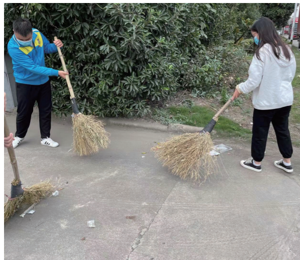
◆ 浙江公司机关党支部义务清理打扫宁波霞浦物流园区街道

三是建立机制、长抓不懈。浙江公司党委建立“我为群众办实事”跟踪落实机制,要求党群工作部在每期党委会上汇报跟踪落实情况,谨防把“我为群众办实事”实践活动办成“一阵风”式活动,