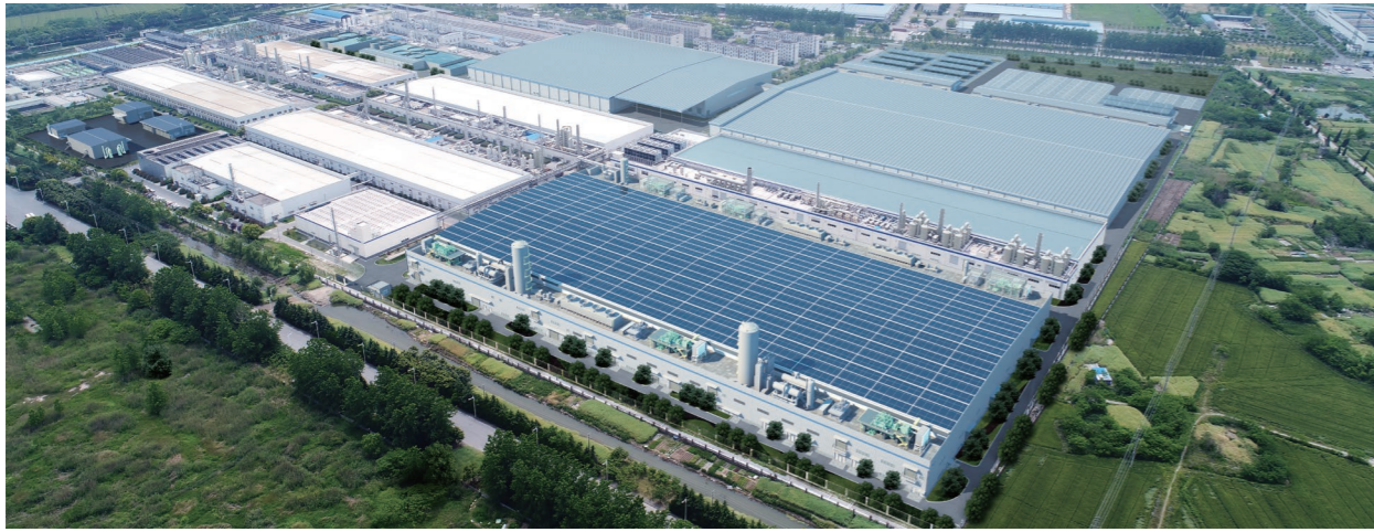
◆ 工建公司承建的晶澳光伏组件(扬州)项目(效果图)

措施。施工前,项目部已经对建设重难点进行了详细分析,从进场开始,就着手了钢结构制作工作。