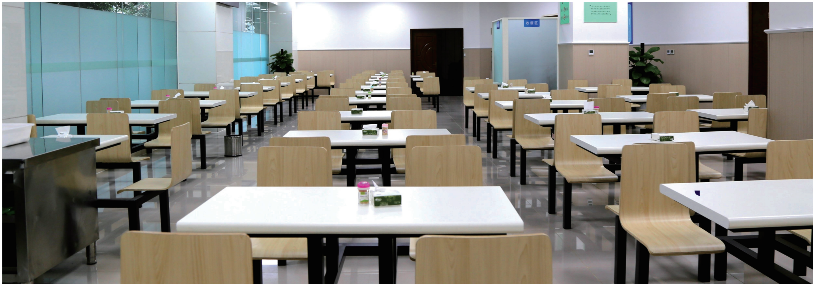
◆ 改造后的成都大楼食堂

是这么做的。从综合办公大楼智慧食堂运行开始，他们就一直秉持着“做有情怀的、幸福的、受人尊重的十九冶人”的初心，广泛收集员工群众的意见，提升精细管理服务水平，多次改进、完善团餐服务，增加员工的满意度，提升大家的就餐体验，让大家在忙碌工作的之余感受到满满的幸福。