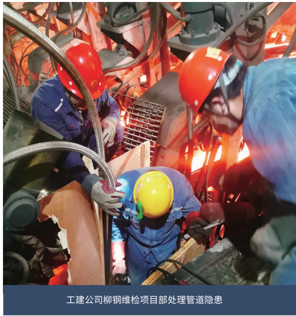
工建公司柳钢维检项目部处理管道隐患