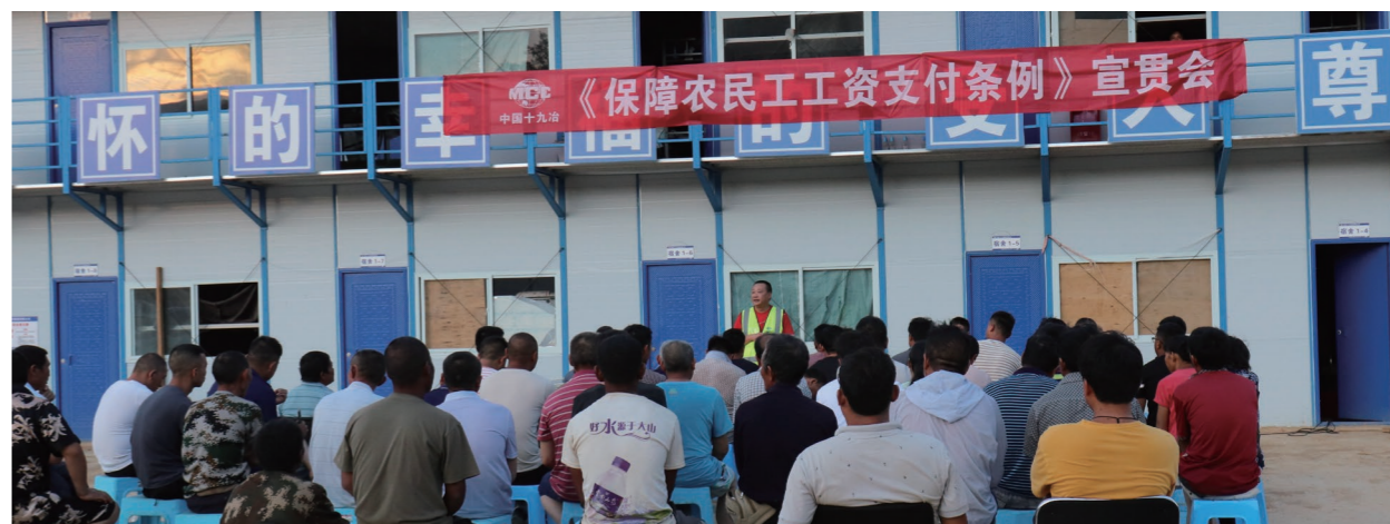
◆ 永勐高速项目党支部为施工人员宣贯《保障农民工工资支付条例》

“支部建在项目上、党旗插在工地上”。永勐高速开工建设以来，项目党支部始终坚持党建引领，筑牢思想主心骨，始终把党的领导贯穿于项目全生命周期经营管理工作，不断探索党建工作与生产经营深度融合的路径，将项目部党支部打造成坚强的战斗堡垒，以高质量党建助推项目高质量履约，努力打造具有鲜明特色的“西部铁军”党建品牌，积极彰显中央企业在地方经济发展中的“压舱石”“顶梁柱”作用。