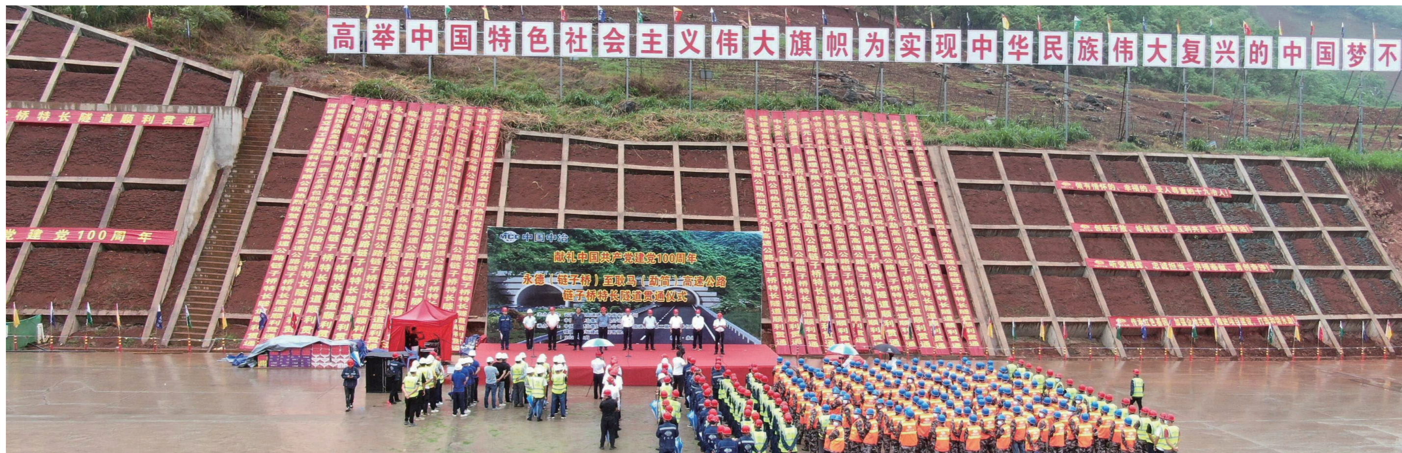
◆ 永勐高速链子桥隧道贯通献礼建党100周年

得感、幸福感、安全感。营造安宁祥和的生产工作环境，以安全保障员工做有情怀的、幸福的、受人尊重的十九治人。