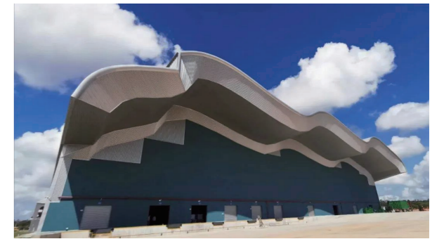
◆ 深圳公司承建的广东阳江纯净水厂厂区项目

深圳公司在水质提升、雨污分流、水源治理等领域深耕多年,积累了高效追踪能源环保项目的信息资源库,这为第一时间掌握市场信息提供了坚实的基础。公司要求市场开拓队伍做到以下几点:一是积极学习习近平总书记生态文明建设思想,牢固树立生态环境保护意识;二是紧盯国家与地方指定的报刊、信息网以及其他媒介,关注能源环保类项目招标公告;三是注重自身业