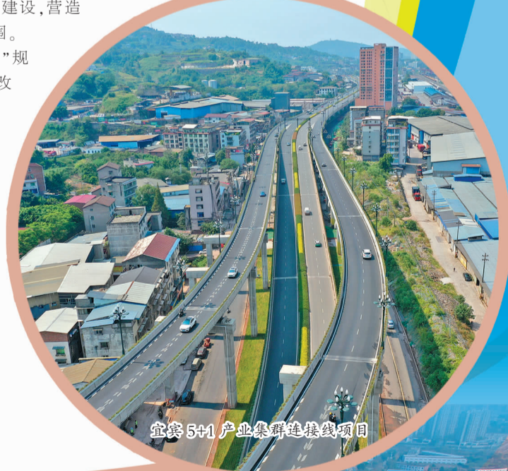
宜宾5+1产业集群连接线项目