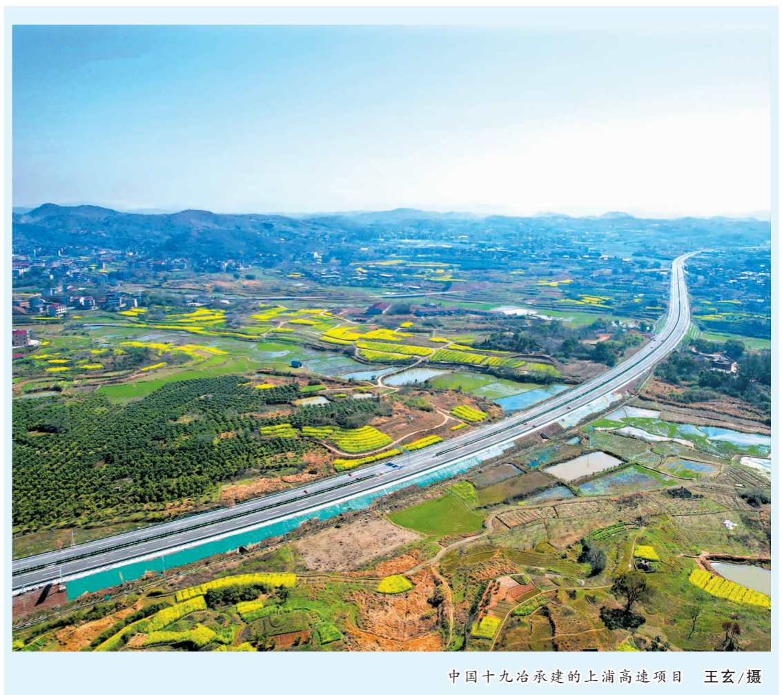
中国十九冶承建的上浦高速项目