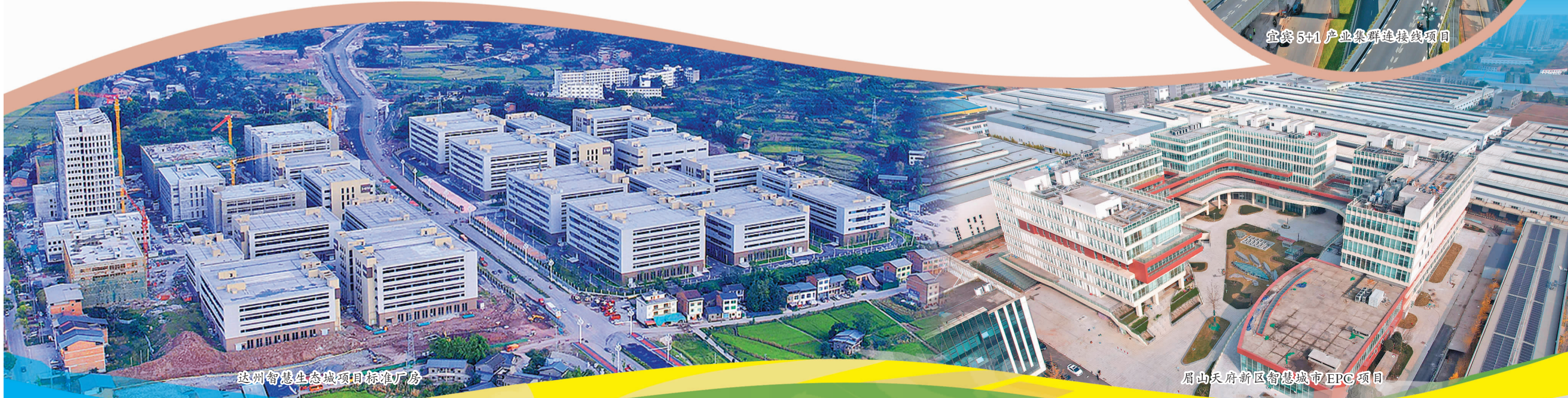
达州智慧生态城项目标准厂房