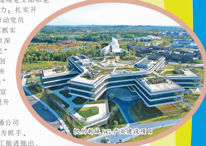
凯州新城5G产业建设项目