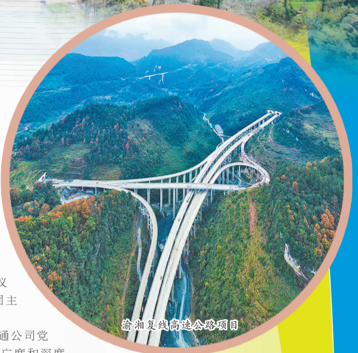
渝湘复线高速公路项目

2025年是“十四五”规划收官之年,也是国企改革深化行动决胜之年,高质量发展之路任重道远。新的一年,市政交通公司将奋楫笃行,不遗余力拼市场、千方百计保营收、坚定不移抓安全、标本兼治防风险、持之以恒强党建,全力以赴开创高质量发展新局面。