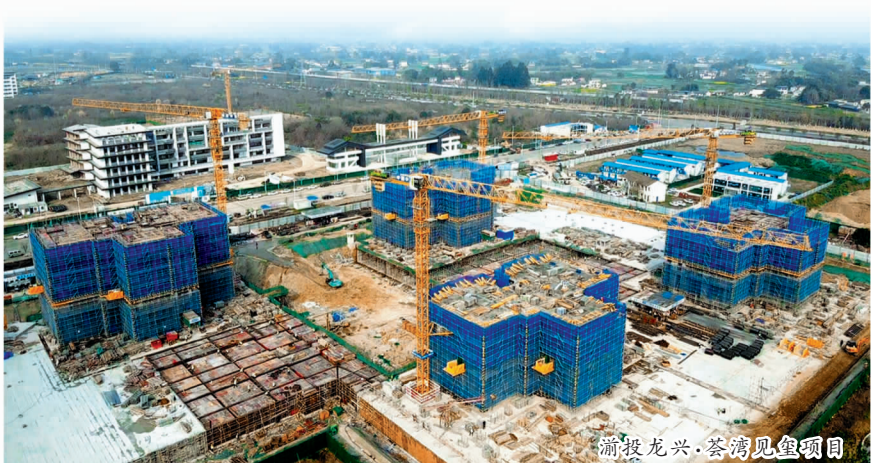
蒲溪龙兴·茶湾见里项目