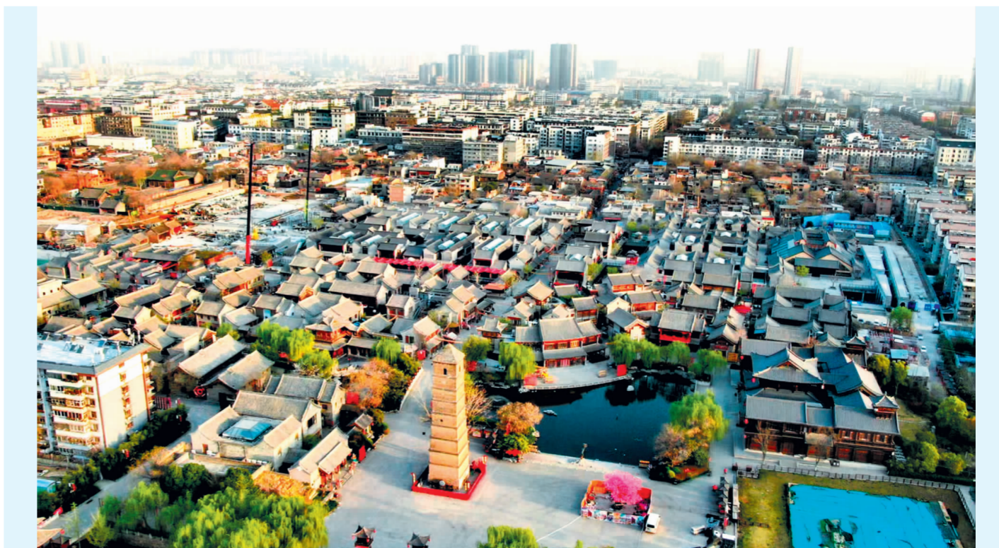
中国十九冶承建的洛阳市老城区建春门片区提升改造项目(陈星宇摄)