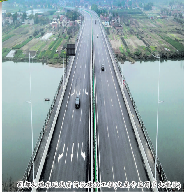
郫都大道东延线管架渠建设工程(蛟龙寺至蜀乡大道段)