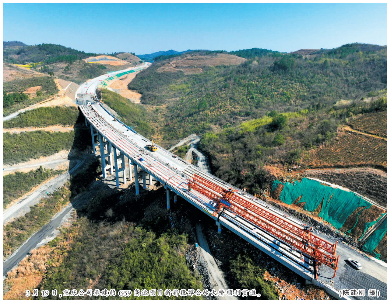
3月19日,重庆公司承建的G59高速项目新新段跨岭大桥顺利贯通。