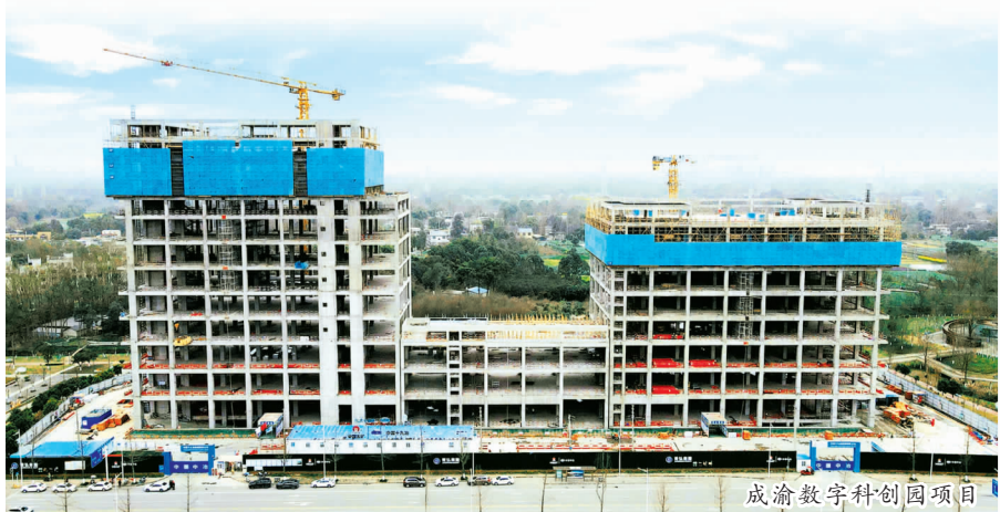
成渝数字科创园项目

征程乍起,满目葱茏;东风浩荡,千帆竞发。2024年,成都建设在转型中求新,在发展中求变,走过了一段盘桓曲折的上山路,或许山路前方还是山路,或许山路前方就是山顶,只要方向正确,何妨关山难越!随着跨年钟声的敲响,我们来到了崭新的2025年。新的一年,成都建设将一如此前,越关山,平大道,向着全面实现“6339”奋斗目标,快速成长为“四自两体”标杆典范,早日跨入中国中冶三级机构百亿俱乐部接续奋斗。