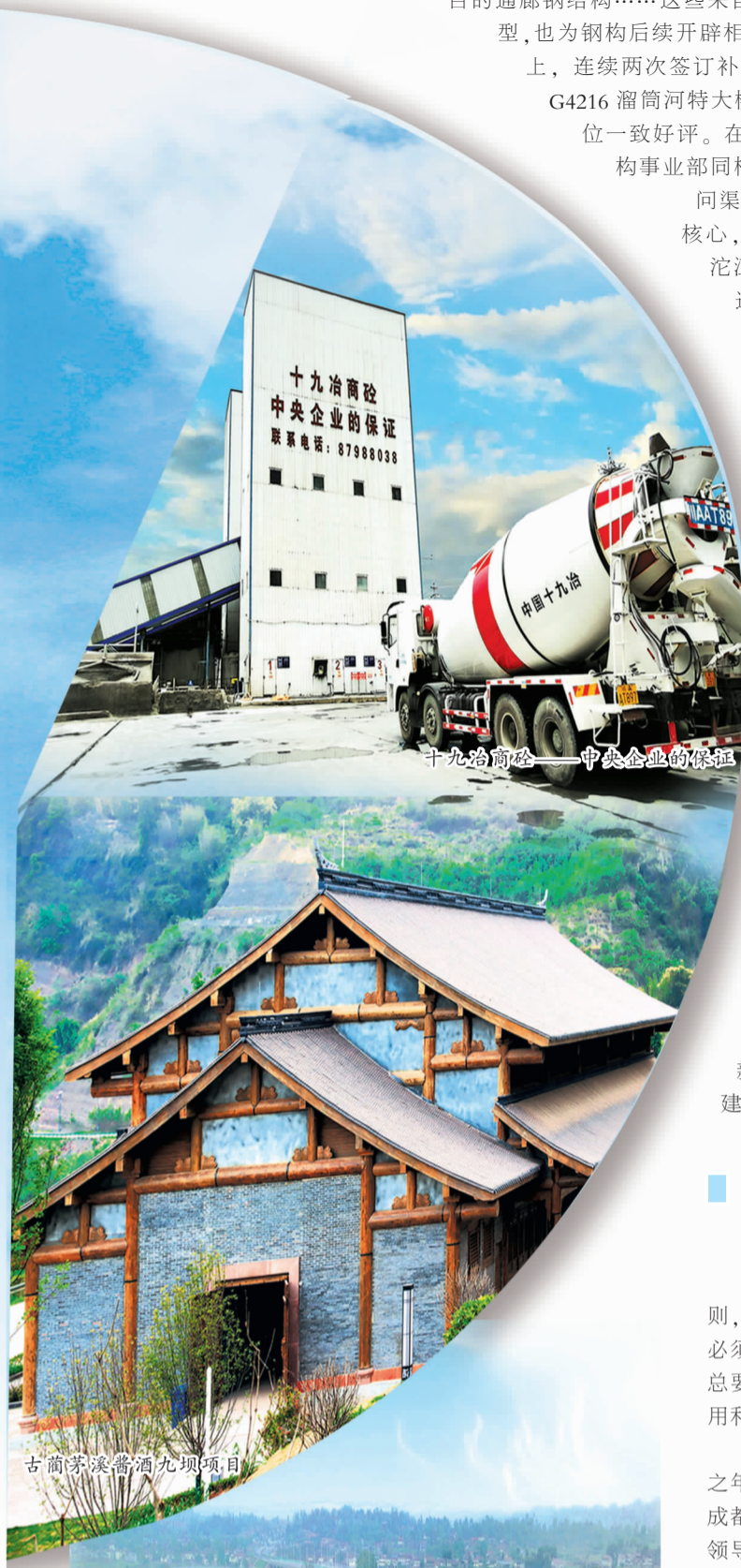
古蔺茅溪酱酒九坝项目