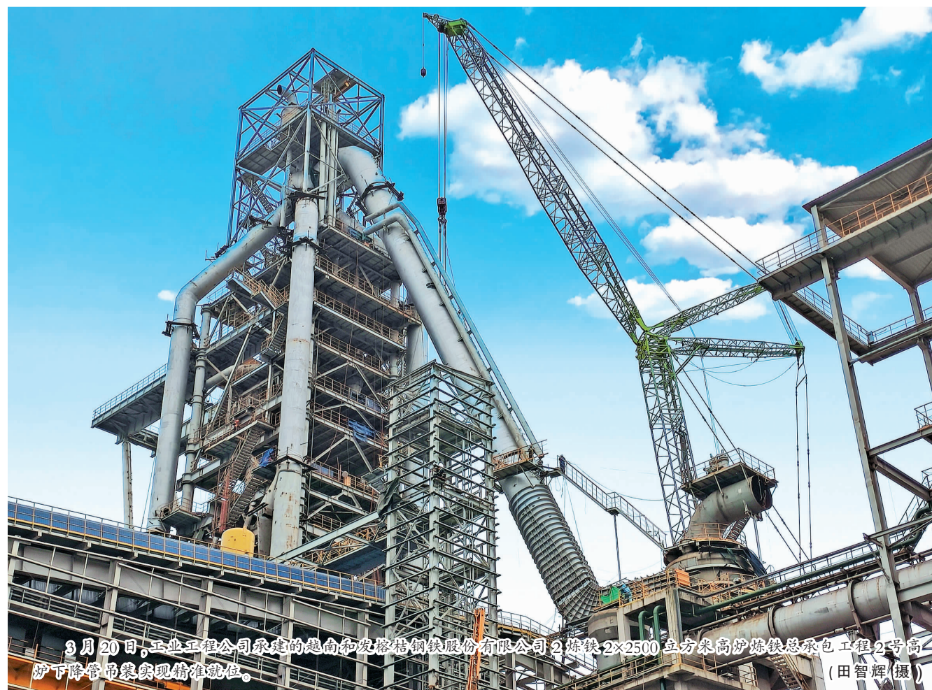
3月20日,工业工程公司承建的海南和发格特钢铁股份有限公司2号转炉2x2500立方米高炉炼铁总承包工程2号高炉下降管吊集实现精准就位。