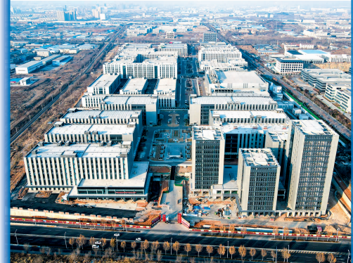
淄博电子信息科创园项目