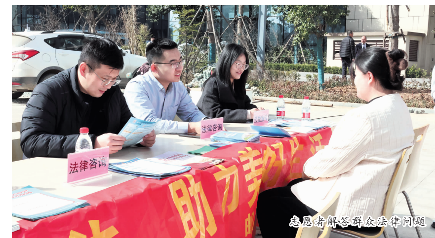
志愿者解答群众法律问题

活动当天,山东公司团委组织机关法律相关专业青年员工组成普法志愿团,与唐冶街道司法所、玖唐府社区、中国邮政历城区支行、属地律师事务所四家单位共同开展普法活动。活动现场,志愿者们通过设置法律咨询台、发放宣传资料等方式,向过往群众宣传《消费者权益保护法》,重点介绍解决消费纠纷的五个途径、消费者的权利等内容,通过“法治小课堂”“法律咨询台”及“普法宣传”,向居民们答疑解惑,科普了关于消费的法律知识,让群众进一步了解如何保护自身