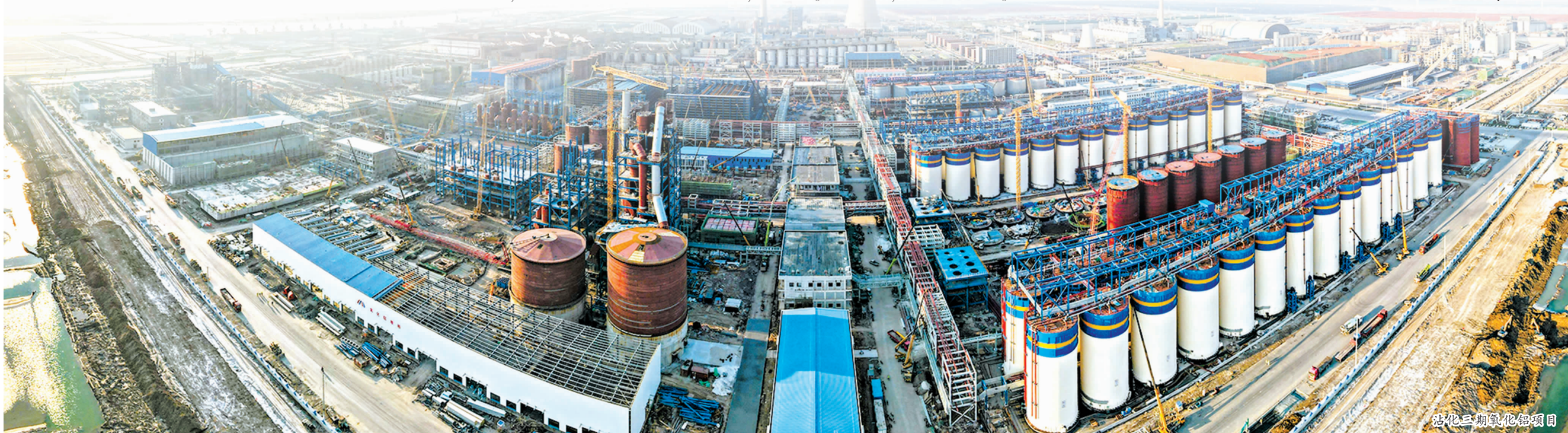
沾化三期氧化铝项目