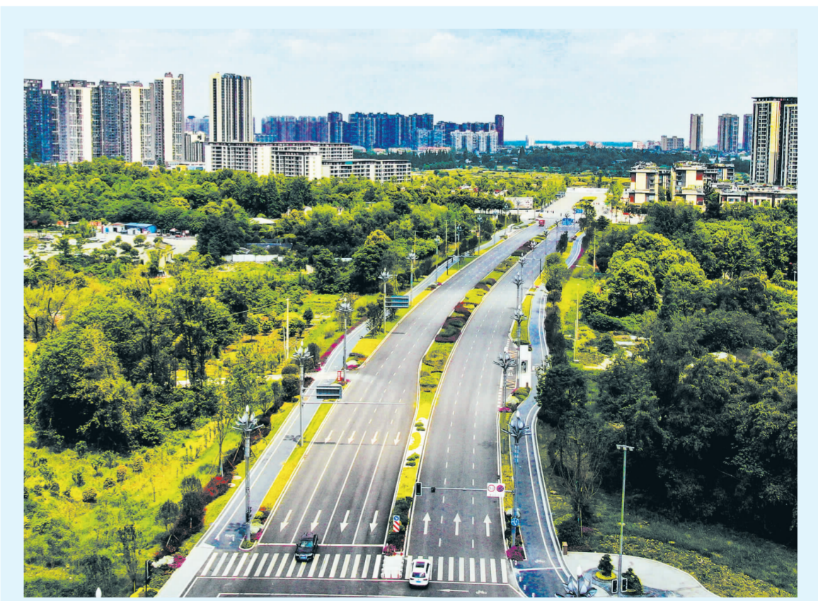
中国十九冶承建的成都市郫都区望丛祠大街南延线(北段)。该项目位于成都市科创新城中的望丛文化片区,是南北向城市次干路,起于成灌高速下穿,止于中信大道,是连接望丛祠与芙蓉湖的绿廊道路,全长约596米,设计速度50千米/小时,规划红线宽度45米。