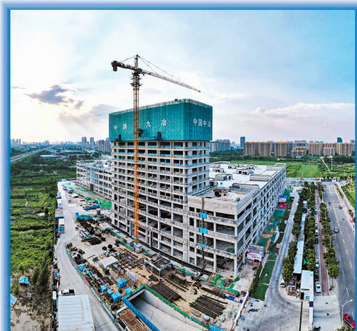
潍坊车时光汽车城项目

2025年将是攻坚克难、充满挑战的一年，也是砥砺奋进、破浪远航的一年，山东公司必将深入落实上级各项工作部署，主动作为、积极进取，统筹抓好安全态势平稳、市场营销突破、经营管理提升、合规管理深化、项目履约提质、人才队伍建设、党建引领保障等各项重点工作，淬炼推动高质量发展的硬本领，争当高质量发展的“急先锋”，全面推动山东公司高质量发展再上新台阶！