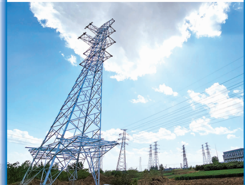
泰安高新区汶河产业园电力工程