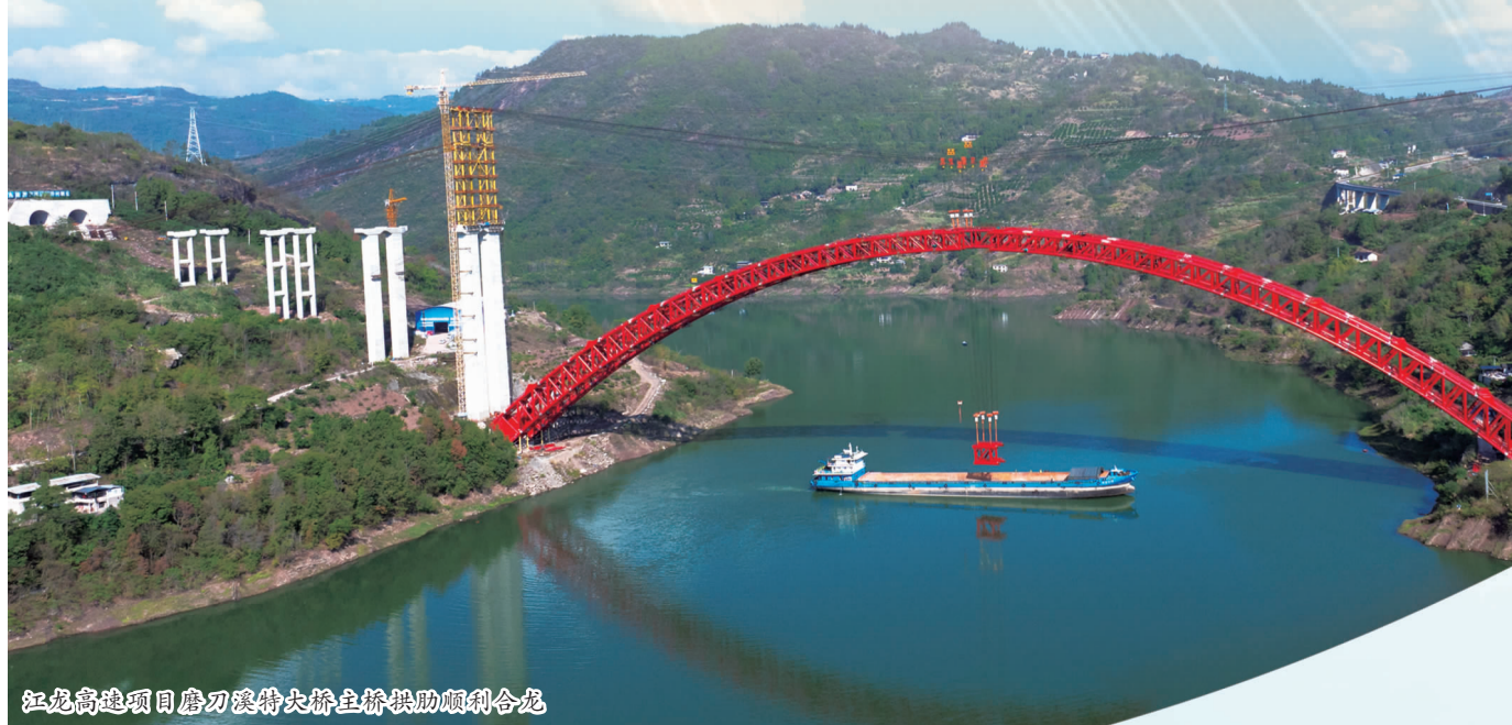
江龙高速项目磨刀溪特大桥梁主桥拱肋顺利合龙

赓续荣光启新程,奋楫笃行向未来。回望2024,我们以汗水浇灌收获,以实干笃定前行;展望2025,我们将以奋发有为的干劲、只争朝夕的拼劲、笃行不怠的韧劲,在区域化发展中开新局,在精细化管理中谋突破,在科技创新中攀高峰,奋力书写新时代重庆建筑高质量发展的壮丽篇章!