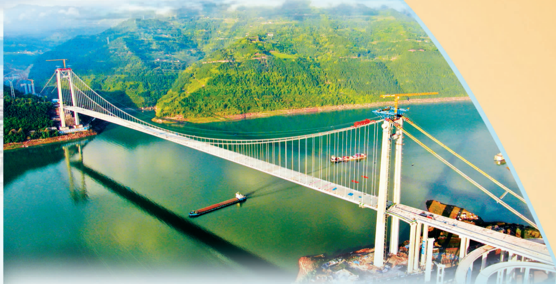
江龙高速项目复兴长江大桥合龙

全面推进标准化工地建设,各项目严格落实安全文明标准化工地目标。江龙高速项目、G59高速项目、綦江项目、万盛项目、对外经贸学院项目均制定了标准化建设方案,其中万盛项目、綦江B25-3厂房项目、对外经贸学院项目已通过重庆市安全文明标准化工地第三阶段验收,展现了重庆建筑在标准化建设方面的卓越成效。