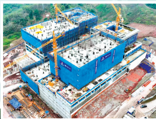
广州中医药大学附属第一医院项目