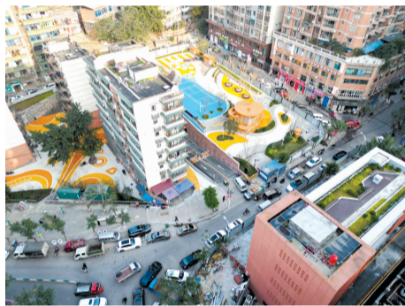
綦江食品园区项目代家岗片区城市更新工程

优秀工程质量成果奖1个、省部级以上QC成果4项、市级QC成果1项。在科技创新创奖方面,受理专利13项、省部级工法4项、发表论文4篇、自立项课题5项,同步完成高新技术企业认定。