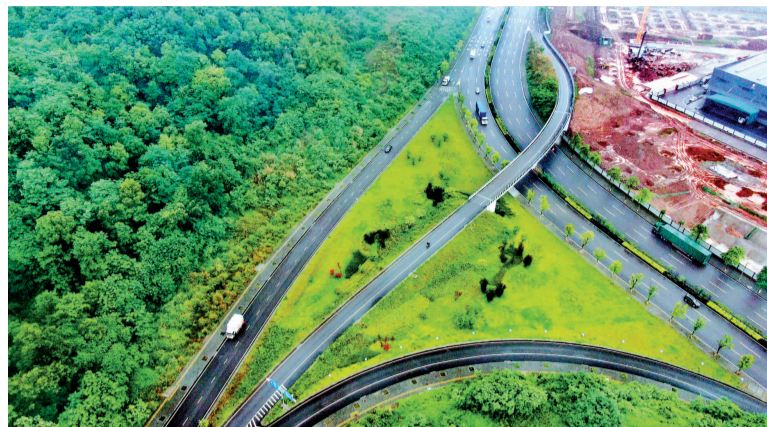
重庆国际物流枢纽园区四期工程中干东线道路

2024年,是新中国成立75周年,是深入实施“十四五”规划的攻坚之年,也是重庆建筑融合发展的提升之年。这一年,百年变局加速演进、外部环境更趋复杂、建筑行业深度调整……困难比预料的多,挑战比预想的大。然而,勇者无畏、智者无惧,重庆建筑上下以“闯”的精神、“创”的劲头、“干”的作风,在开拓中谋突破,在创新中求发展,在管理中提效能,交出了一份亮眼的年度答卷。