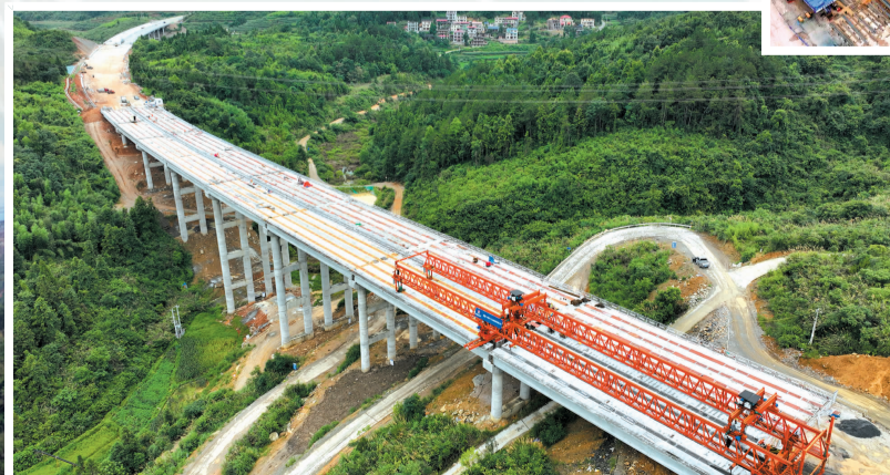
G59高速新段烟竹寺1号大桥梁板顺利架设