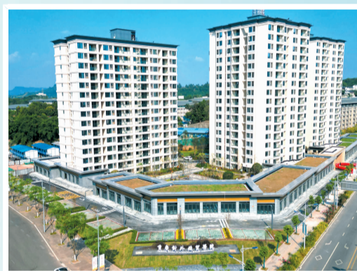
重庆对外经贸学院新校区项目三期工程

在贵州航空产业城112项目“3.30”攻坚战的阵地上,在江龙高速项目磨刀溪特大桥梁的壮阔场景中,在广州中医药大学第一附属医院重庆医院项目争分夺秒的施工现场,党员们始终冲锋在前,以实际行动诠释责任,用担当书写忠诚,成为攻坚克难的中坚力量。重庆建筑聚焦于深度、着力于创新、用功于实在,坚持党建工作与生产经营同频共振,把红色力量转化为推动重庆建筑高质量发展的有力行动。