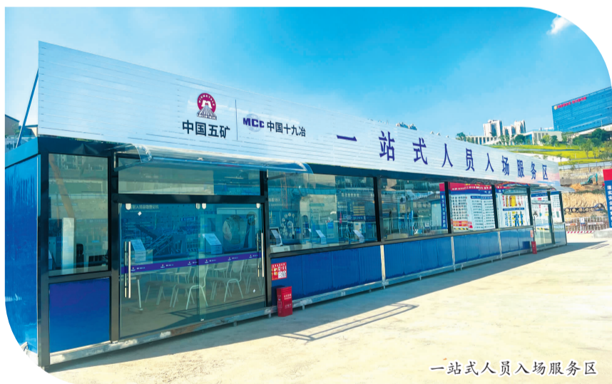
一站式人员入场服务区