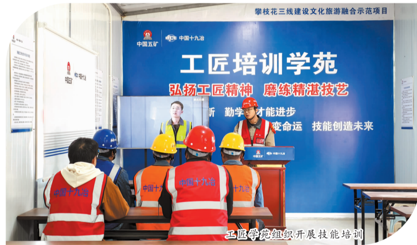
工匠学苑组织开展技能培训