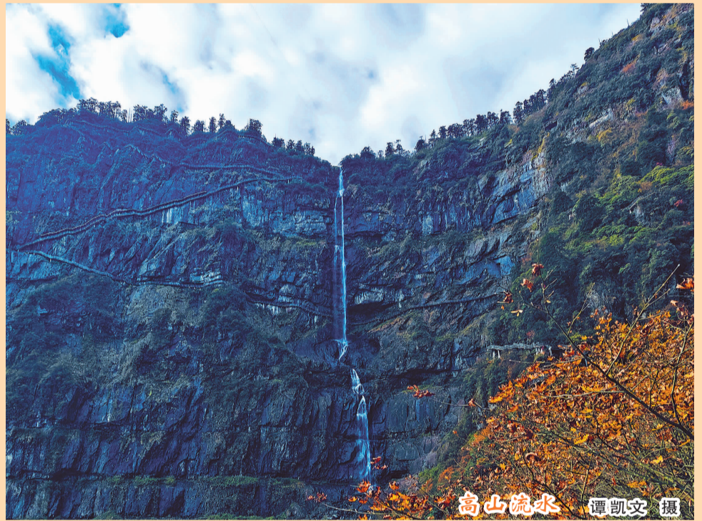
高山流水