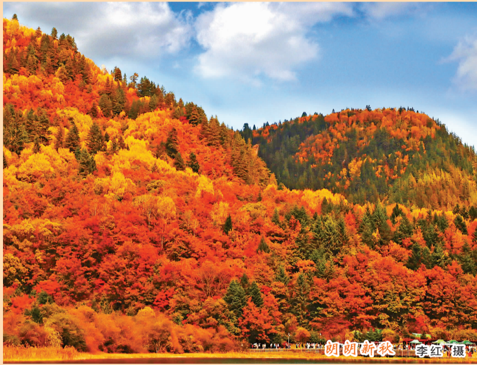
朗朗新秋