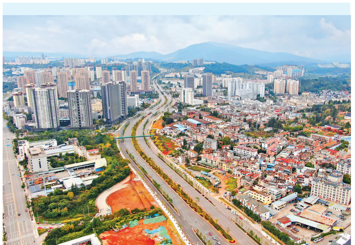
中国十九冶承建的安宁市石安公路(安宁入城段)改造工程

为期3天的培训取得了积极效果,对当下公司统一设计管理工作思想,探索设计管理方向,夯实设计管理业务水平奠定了坚实的基础。未来,公司将持续加强设计管理人才队伍建设,积极探索设计创效、技术创效、科技创效之路,贯彻“大商务”管理理念,助力企业高质量发展。(通讯员 陈伟平)