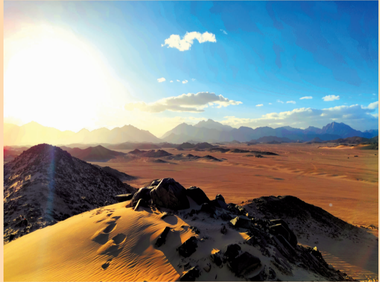
荒野沙漠