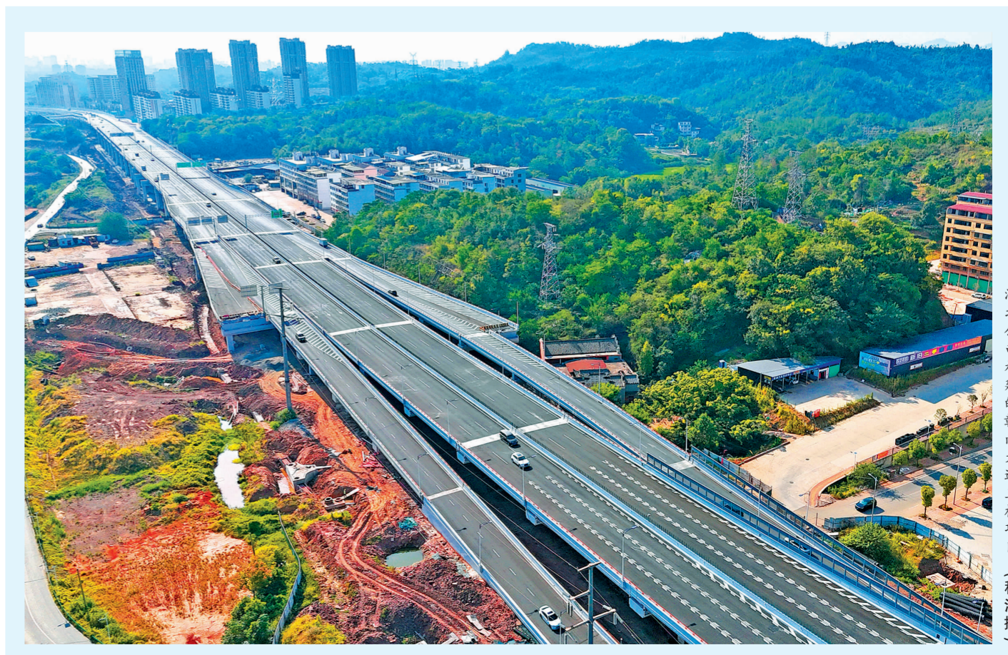
湖北公司承建的赣南大道三标项目

要求:一是抢市场,拼指标,谋发展。要发挥区域优势,加大优质资源储备,优化市场布局,确保年度指标达标,为明年开局发展奠定基础。二是抓清欠,保利润,稳增长。要细化措施,压实责任,明确奖惩,积极思考提质增效的方式方法,切实提高重点工作的执行力和执行效果。(紧转第二版)