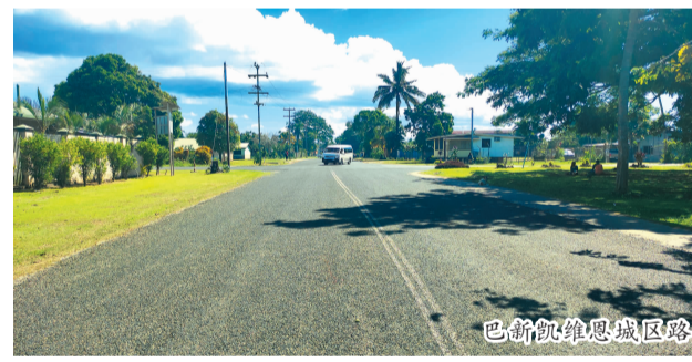
巴新凯维恩城区路

他迅速适应新角色,将一线党务工作经验与支部建设紧密结合,推动支部工作不断创新发展。他深知,作为一名党务工作者,不仅要自己学得好、做得好,更要带动整个支部乃至更多党员共同进步。