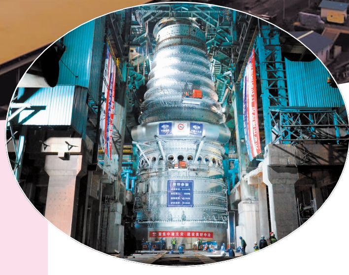
▲ 南钢2号高炉节能降耗技术改造项目