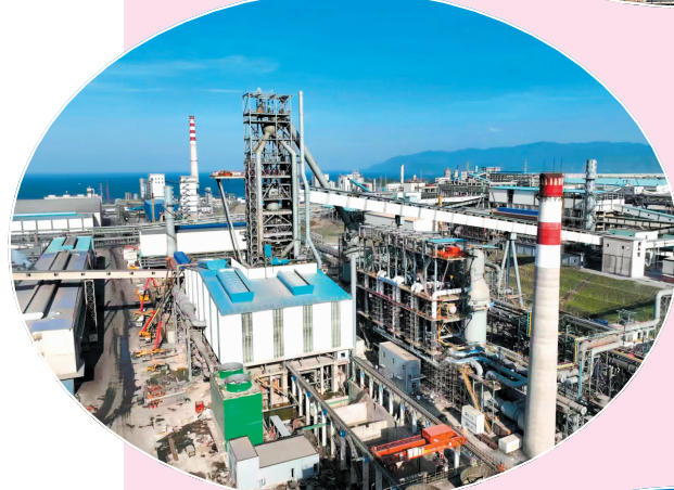
◀ 印尼德信钢铁3号高炉项目