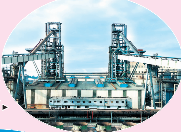
▶ 印尼德信钢铁1号、2号高炉项目