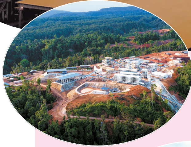
◀ 印尼塔岛铁矿项目