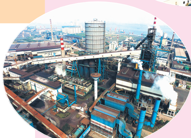
◀ 江阴兴澄特钢3200立方米高炉工程