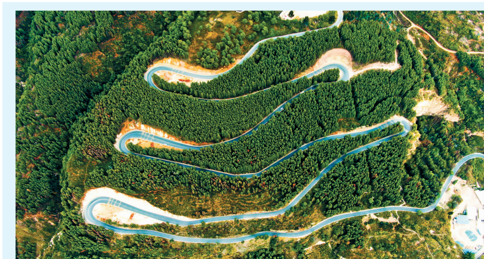
玉溪市红塔区「十四五」重点城市基础设施提升项目北前线路改造工程施工