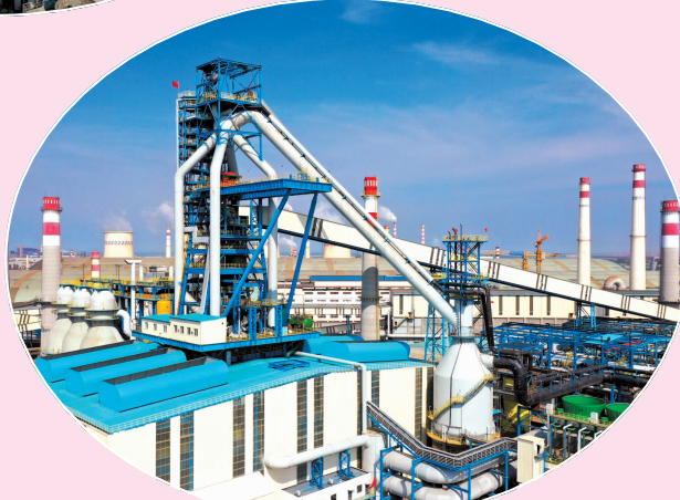
▶ 日照钢铁2号高炉项目