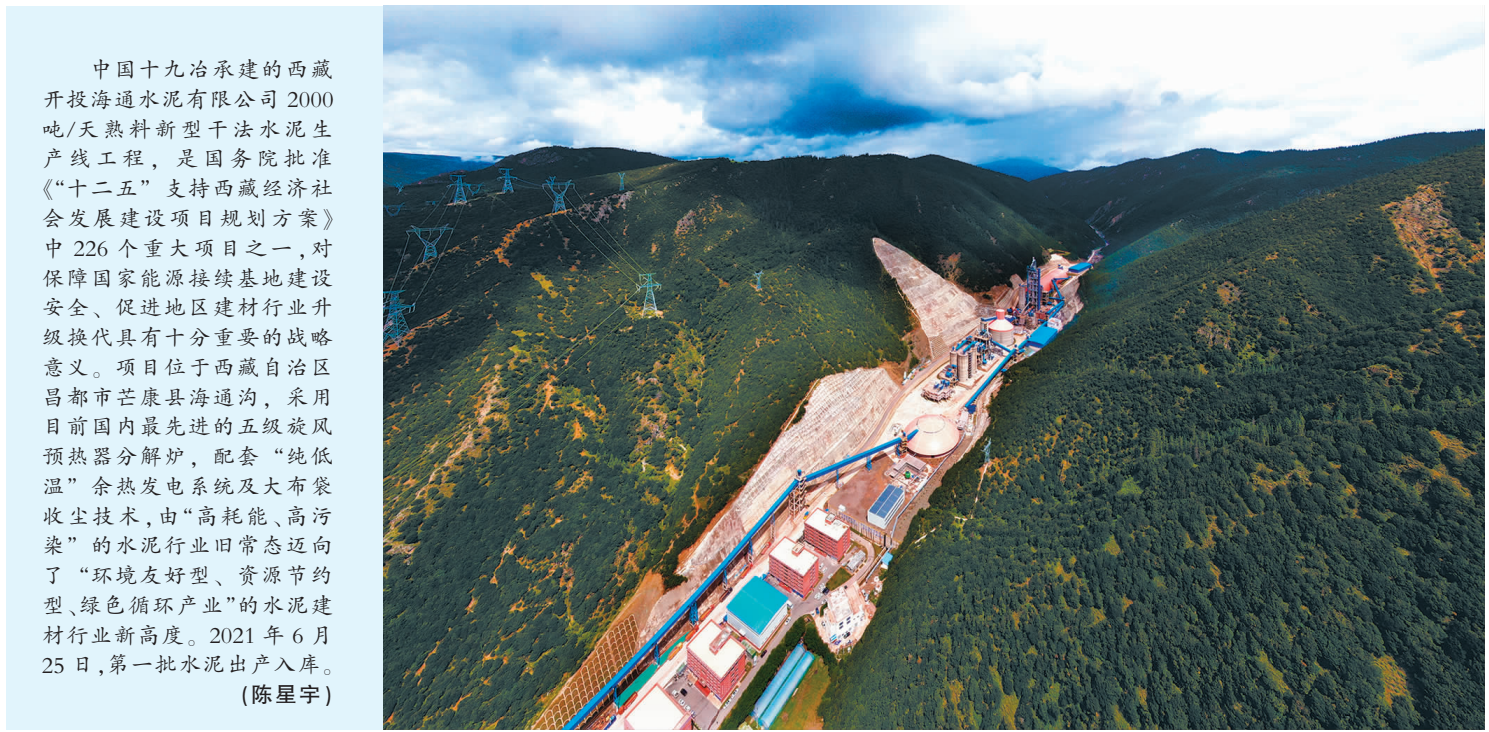
中国十九冶承建的西藏开投海通水泥有限公司2000吨/天熟料新型干法水泥生产线工程,是国务院批准《“十二五”支持西藏经济社会发展建设项目规划方案》中226个重大项目之一,对保障国家能源接续基地建设安全、促进地区建材行业升级换代具有十分重要的战略意义。项目位于西藏自治区昌都市芒康县海通沟,采用目前国内最先进的五级旋风预热器分解炉,配套“纯低温”余热发电系统和大布袋收尘技术,由“高耗能、高污染”的水泥行业旧常态迈向了“环境友好型、资源节约型、绿色循环产业”的水泥建材行业新高度。2021年6月25日,第一批水泥出产出库。(陈星宇)