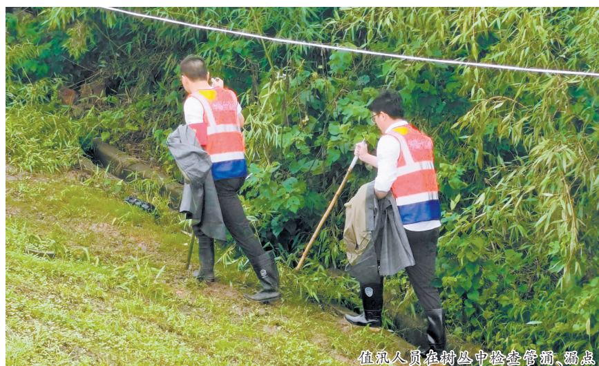
值汛人员值岗中检查管涌、漏点