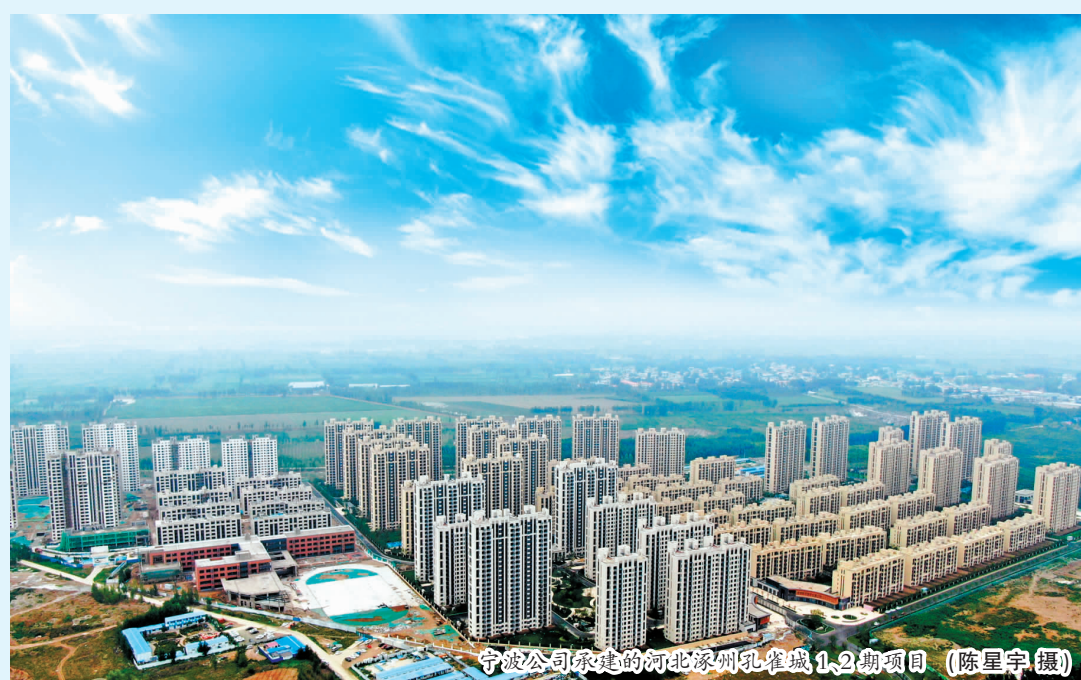
该项目位于河北省涿州市东城坊镇,由华夏幸福基业有限公司投资建设,中国十九冶承建的二标段包括:24栋住宅楼及2个配套工程项目的施工任务,建筑面积约31万平方米。该项目相继被业主和地方政府评定为“房建市场安全文明施工管理标杆项目”、“文明施工扬尘治理先进典型项目”。

集团公司工程管理部、质量技术部、党群工作部、攀枝花综合管理部等部门负责人,安全环保部全体人员,分子公司总经理,分管安全环保、生产工作的领导,集团公司参建单位对应的分子公司部门负责人,江苏、安徽、江西、湖南、湖北、云南、重庆片区的重点项目及防洪度汛存在较大风险的项目部项目经理、安全总监及安全部门负责人现场参会或通过视频方式参会。(章明全)