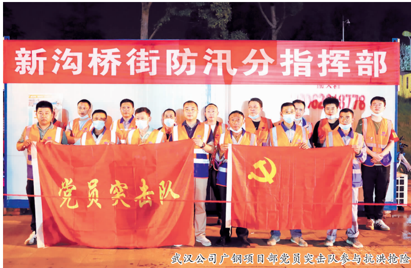
武汉公司广钢项目部党员突击队参与抗洪抢险