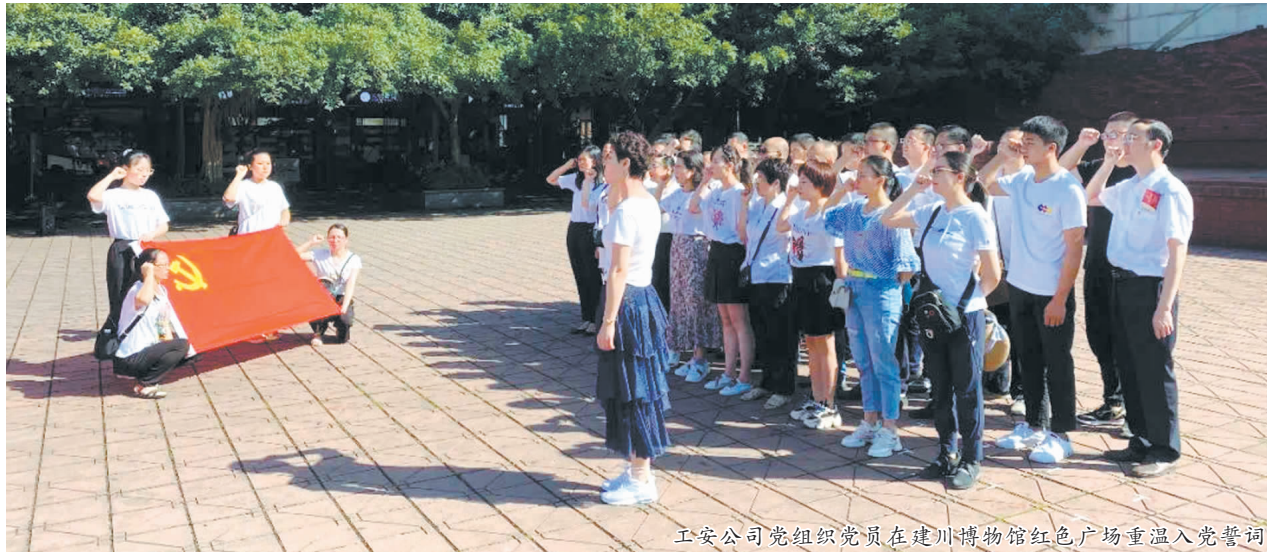
工安公司党组织党员在建川博物馆红色广场重温入党誓词

去年以来,中国十九冶党委在中国五矿、中冶集团党委的坚强领导下,按照“强基础、补短板、创品牌、争一流”的党建工作目标,在中冶集团内首次提出“双五星”党组织建设(“双五星”是指五矿智慧党建APP月度得分达到五星标准,年度累计得分达到五星标准党组织建设),首次将公司142个基层党组织和1835名在岗共产党员的活跃情况,依托五矿智慧党建APP大数据功能,进行过程跟踪、适时监督、适时检查和同步考核,促进基层党组织切实承担起教育党员、管理党员、监督党员和党组织标准化建设的职责,进一步将党员队伍优势转化成为中国十九冶的核心竞争力优势,将党的全面领导和党的全部工作落实到具体的生产经营活动中去,全面发挥“双五星”党建引领作用,构建起中国十九冶基层治理新格局。